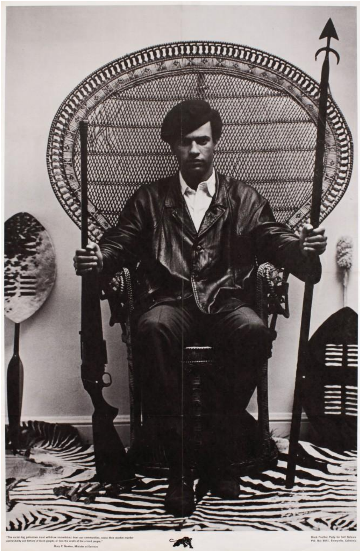
Fig. 8. Fotografi tilskrevet Blair Stapp, opstilling af Eldridge Cleaver, Huey Newton seated in wicker chair, 1967. Litografi på paper. Collection of Merrill C. Berman. Photo: © Merrill C. Berman Collection.