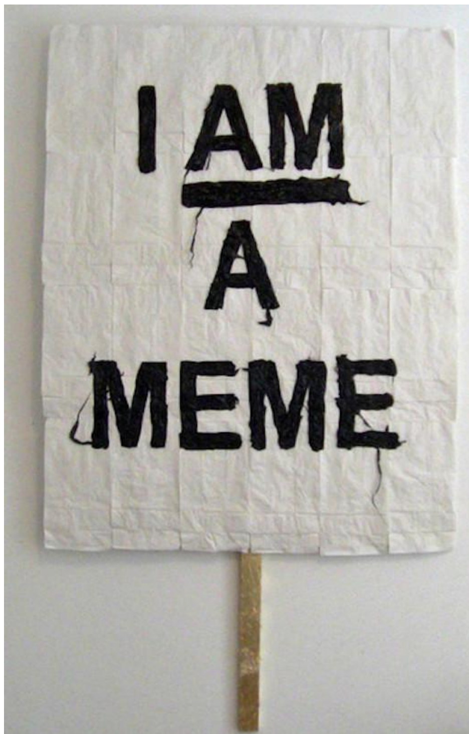
Fig. 7. Nathaniel Donnett, How Can You Love Me And Hate Me At The Same Time? , 2011. Papirposer, plastik, bladguld og træ. Foto: © Courtesy of the artist.

101,6 x 63,5 cm. National Gallery of Art, Washington, inv. nr. 2012.109. Foto: © Courtesy of the artist.