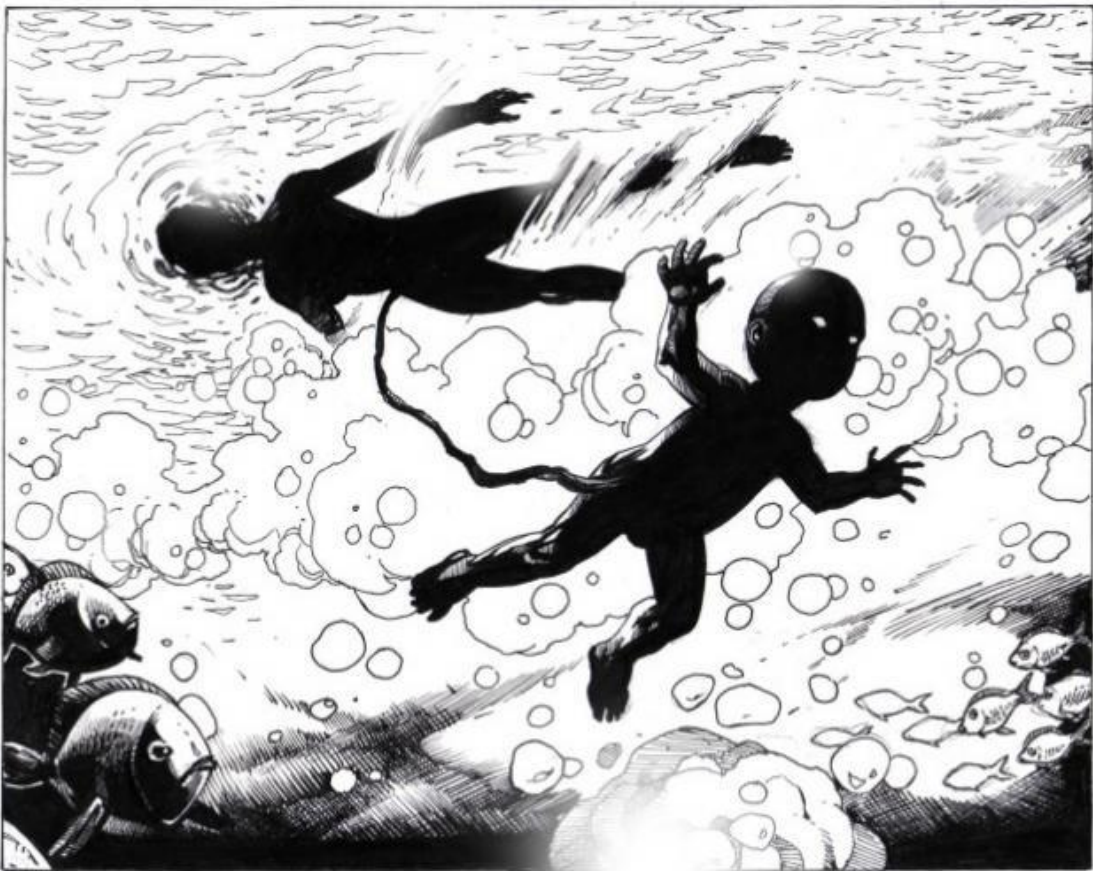
Fig. 13. Drexcia og A. Qadim Haqq, Illustration til 'The Book of Drexcia