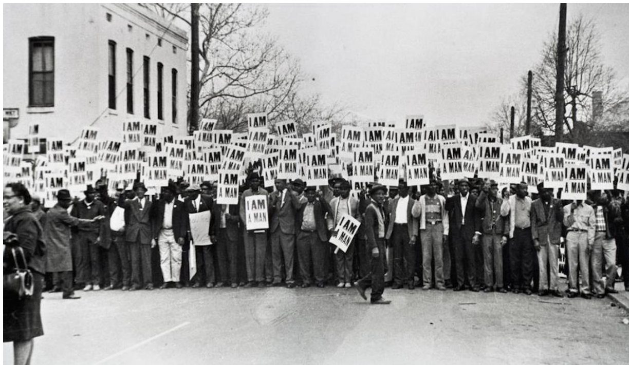
Fig. 5. Ernest C. Withers, I Am A Man, Sanitation Workers Strike, Memphis, Tennessee, March 28th, 1968. Gelatin silver print, 27,8 × 47,8 cm.