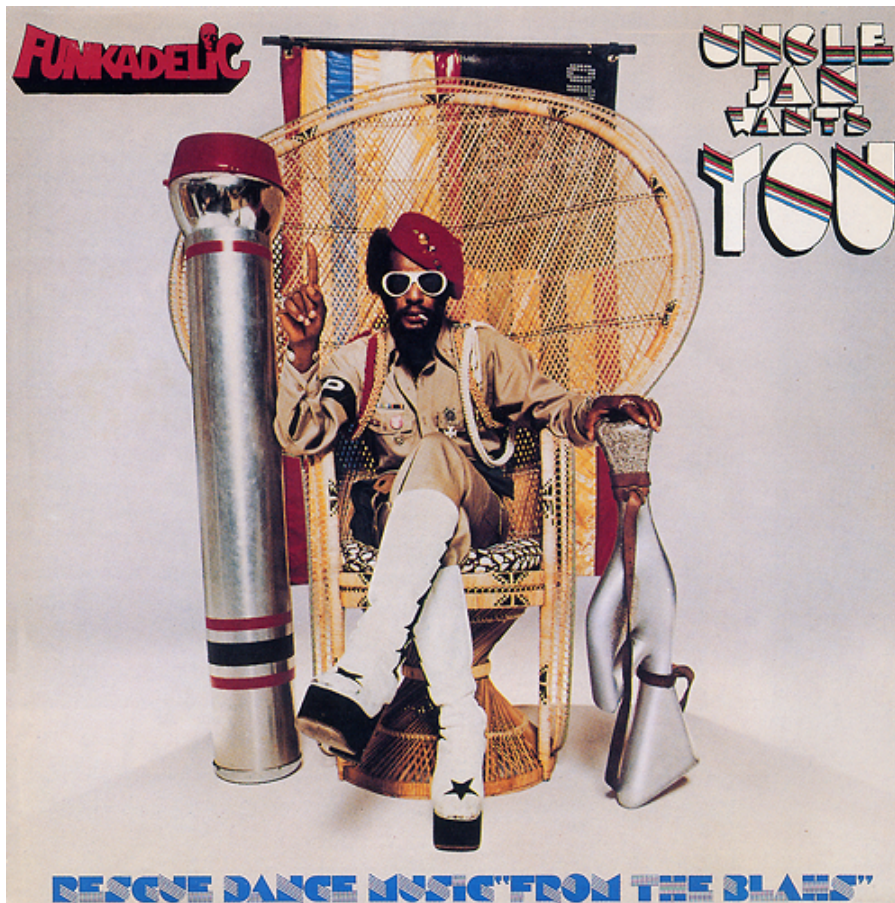
Fig. 11. Funkadelic, Uncle Jam wants you, 1979.