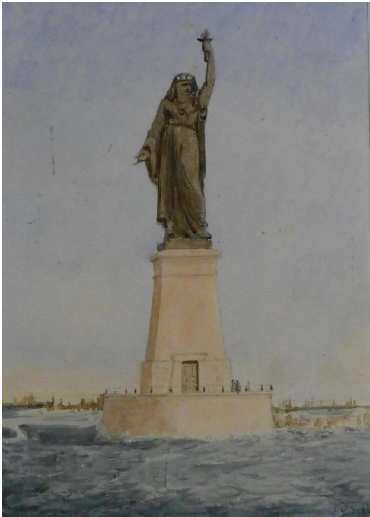
Fig. 4. Frédéric Auguste Bartholdi, Skitse til 'Egypten bærer lyset til Asien' ved Suez, 1869. Akvarel. Musée Bartholdi de Colmar.

Og statuen approprierer da også det visuelle sprog, som er koblet til billedhuggerkunsten og dens monumentale udtryk: Queen Mary sidder på en trone som en regerende monark med en fakkel i hånden, en attribut, der henleder tankerne på andre kvindelige figurer som Frédéric Bartholdis Egypten bærer lyset til Asien [fig. 4] og Frihedsgudinden.