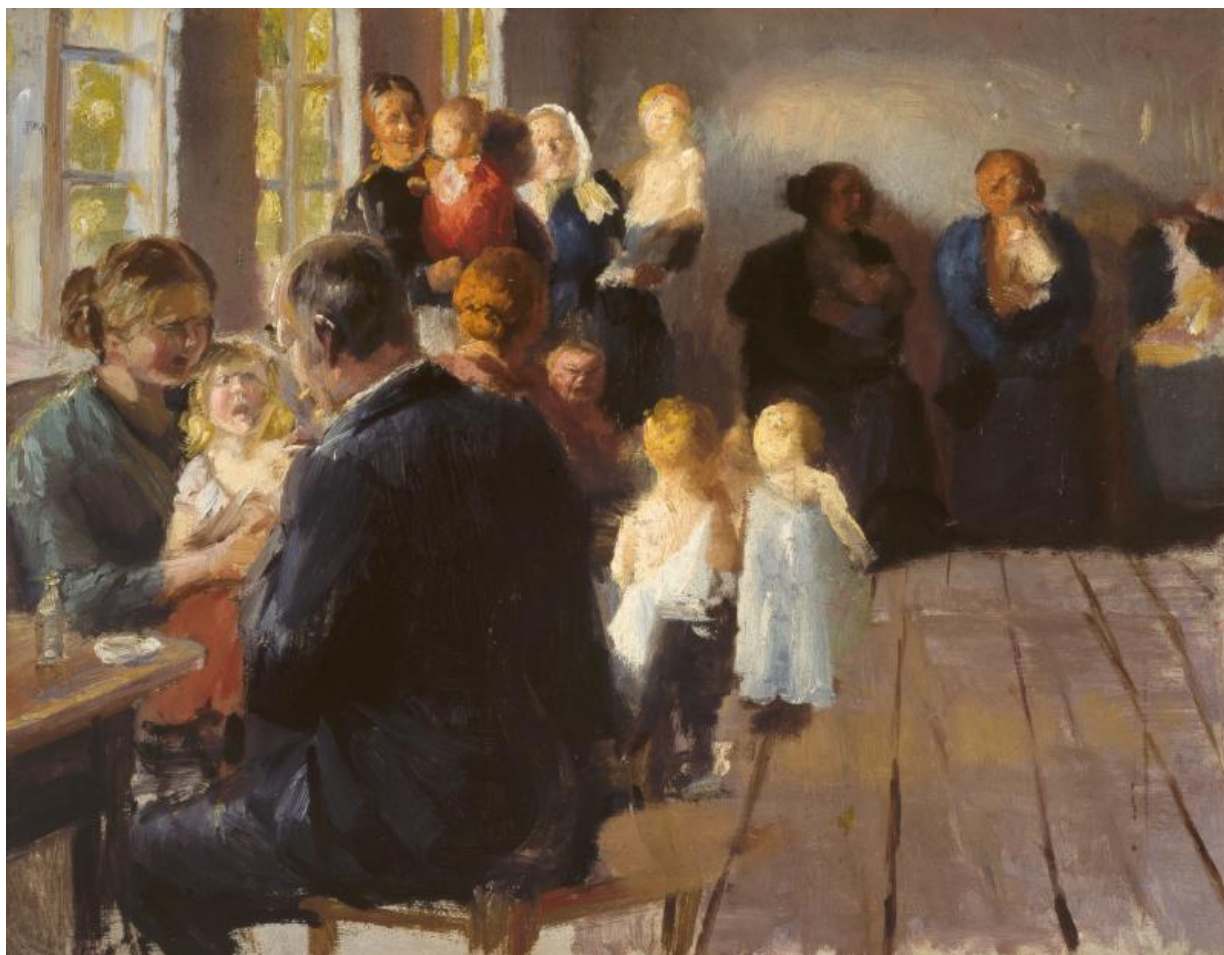
Fig. 6. Anna Ancher, En vaccination . Skitse. (1898/99), olie på pap, 26,9 x 34,9 cm, Skagens Kunstmuseer, SKM1224.