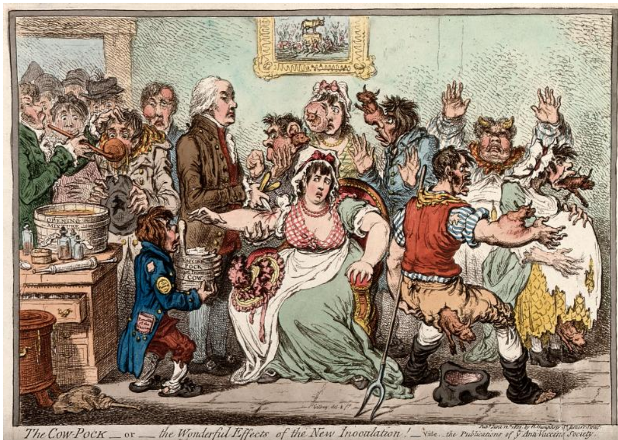
Fig. 8. James Gillray, Edward Jenner vaccinerer patienter på kopper- og inokulationshospitalet ved St. Pancras: patienterne udvikler kolignende gevækster . 1802, farvetryk, 24,8 x 34,9 cm, Wellcome Collection.

I Gillrays tegning er Jenner i færd med at vaccinere en gruppe mennesker, hvoraf flere, efter at have fået vaccinen, har fået ekstra lemmer i form af kolignende gevækster. Anchers værk har imidlertid ikke noget samfundskritisk over sig, ligesom samtidens danske satireblade heller ikke indeholder illustrationer, der forholder sig kritisk til denne handling. 35 I stedet er det mere relevant at vende blikket mod Frankrig, som hun besøgte i 1885 og igen i 1889. Netop i 1880'erne var der flere franske kunstnere der malede værker med både navngivne og unavngivne læger, der vaccinerer med forskellige vacciner. 36 En af dem var Pascal-Adolphe-Jean Dagnan-Bouveret (1852-1929), der i 1882/83 malede Vaccinationen [Fig. 9], et værk der har flere kompositoriske fællestræk med Anchers [Fig. 10]. 37