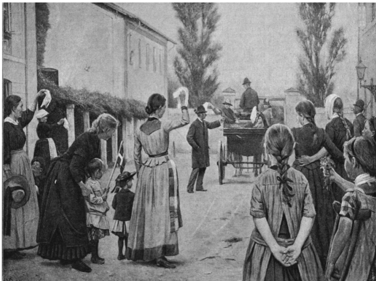
Fig. 15. Valdemar Irminger, Fra kysthospitalet på Refsnæs. Ved udskrevne patienters bortrejse . 1891, ukendt opholdssted, gengivet på forsiden af Illustreret Tidende , nr. 21, 33. bind, 21. februar 1892.

Irmingers værker, hvoraf flere blev udstillet på Charlottenborg Forårsudstilling, har derfor også fungeret som markedsføring af stedet, dets omgivelser og ikke mindst af dets helbredende og samfundsgavnige virkning, særligt fordi Irmingers række af værker fra Kysthospitalet også indbefatter et værk af udskrevne patienter, der kører bort i en hestevogn [Fig.15]. 46 Patienten er helbredt takket være sit ophold og kan hermed forlade Kysthospitalet - uden sine krykker. Værkerne kan ses som en serie, der samlet beskriver livet på Kysthospitalet i Refsnæs og ikke mindst den behandling, som børnene der var indlagt fik. Ud over disse værker var Irmingers foretrukne motivkreds familien og landskaber, og bortset fra værkerne af de syge børn på Kysthospitalet, var det ikke et tema, han beskæftigede sig med igen. Derimod er hans værker af de tuberkuløse børn tilsyneladende de eneste eksempler i dansk kunst på en kunstner, der skildrer sanatoriernes arbejde for at helbrede syge børn.