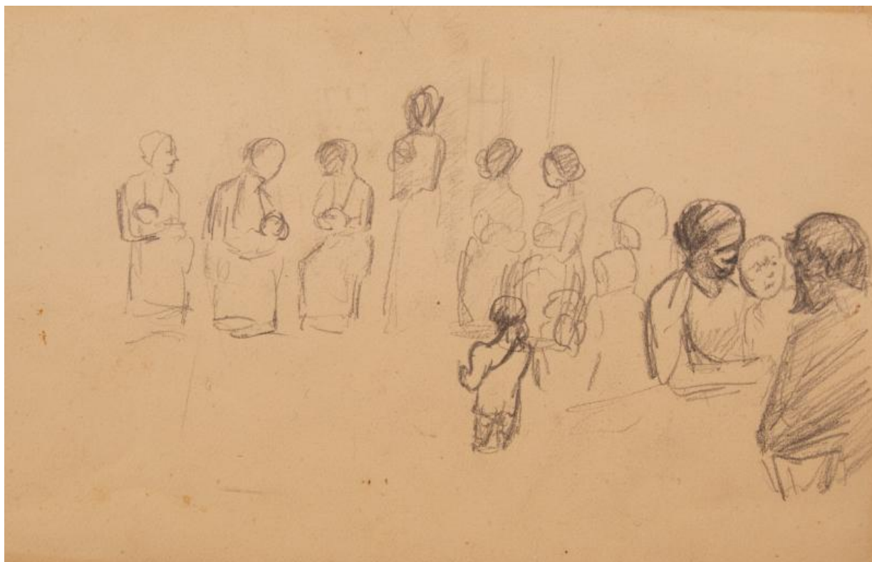
Fig. 4. Anna Ancher, En vaccination. Kompositionsstudie . 1898/99, blyant på papir, 165/162 x 257/245 mm, Skagens Kunstmuseer, HAF10168.