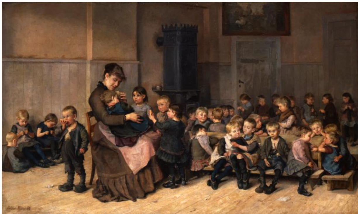
Fig. 16. Emilie Mundt, Fra asylet i Istedgade . 1886, olie på lærred, 82 x 116,5 cm, Københavns Museum, 1981:168X0001.

Mundts maleri indeholder alle de ting, som et børneasyl tilbød de børn, der blev passet der, mens deres forældre var på arbejde: almen dannelse, renlighed, undervisning i håndarbejde, pleje af sår og fysiske skade, nærende kost og undervisning. Børneasylene byggede ligesom Kysthospitalet i Refsnæs på velgørenhed og private donationer, de havde deres egne bestyrelser og var ikke underlagt statslig kontrol. Flere af dem blev senere omdannet til børnehaver, men deres oprindelige formål var, at de skulle varetage den legemlige og åndelige opdragelse af børnene, så deres forældre kunne passe deres arbejde uden for hjemmet, ligesom det var asylernes formål at få børn der var overladt til sig selv i dagtimerne væk fra gaden og fra såkaldt dårlig indflydelse. Samtidig var idéen med børnenes ophold på asylerne også, at de udover at blive passet fik et måltid mad, mælk og vitaminer, og at: "Børnene bliver vaskede et Par Gange om Dagen [...] De som trænger dertil, bliver behandlet med Borvand, Salver, Levertran, Forbinding m.m." 49 Tiltag der skulle forbedre deres sundhed og gøre de kommende generationer sunde og stærke.