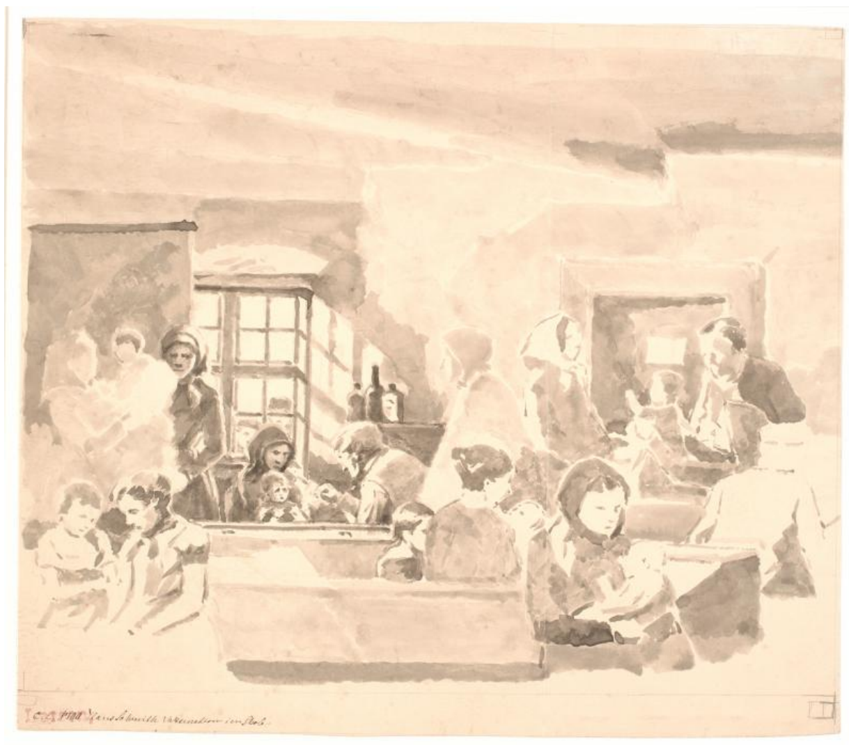
Fig. 12. Hans Smidth, Vaccination i en skole . U.å., blyant, pensel og grå lavering, 290 x 333 mm, Statens Museum for Kunst, KKS1977-311.

(1822-95) opfandt en vaccine mod rabies i 1885, var det den eneste vaccine, der blev tilbudt i det århundrede. På trods af den banebrydende opfindelse var lægerne på dette tidspunkt, som så mange andre professioner, afhængige af dagslys for at kunne udføre deres arbejde, og derfor ser man stort set altid den vaccinerende læge i nærheden af et vindue. Dette er også tilfældet for Anchers læge, og her har lyset ikke blot en kunstnerisk funktion, som lyspletter eller solskin, der falder ind ad vinduet og rammer gulvet eller væggen - her har det også en praktisk funktion. Derfor er vinduet eller den åbne dør nærmest en fast del af vaccinationsværkernes ikonografi.