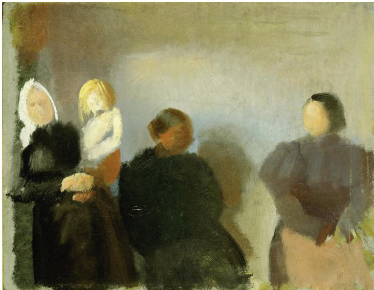
Fig. 7. Anna Ancher, En vaccination . Farvestudie . (1898/99), olie på pap, 26,9 x 34,7 cm, Skagens Kunstmuseer, SKM1206.