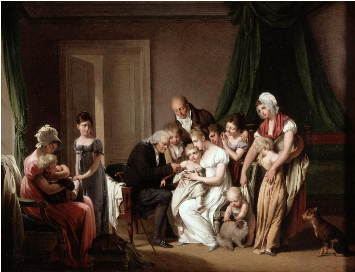
Fig. 11. Louis-Léopold Boilly, En mand vaccinerer et barn, der bliver siddet hos sin mor mens andre medlemmer af husstanden kigger på . 1807, olie på lærred, 44,5 x 58 cm, Wellcome Collection.

Kompositionsstudie. Ca. 1882, pen og blæk på papir, 194 x 258 mm, Musée Magnin, Dijon, 1938DF211.