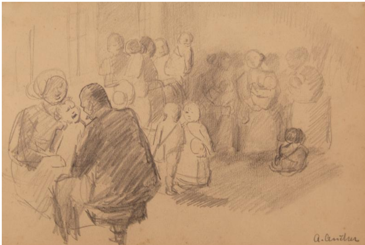
Fig. 5. Anna Ancher, En vaccination . Kompositionsstudie . 1898/99, blyant på papir, 176/175 x 258/257 mm, Skagens Kunstmuseer, HAF10167.

Hvis man sammenligner de to kompositionsskitser kan man se, at den væsentligste ændring ikke var antallet af personer på billedet, men i stedet deres placering i rummet. I den første skitse er de ventende mødre og børn placeret som et temmelig ensartet bånd hen over billedfladen, mens Ancher i den anden skitse har placeret alle personerne, inklusiv lægen, i billedets højre side og derudover skabt variation i menneskemængden ved at lade nogle af mødrene stå op, mens andre sidder ned. En variation der understreges i to mindre olieskitser, hvoraf den ene er fuldstændig tro mod den tegnede version, bortset fra at olieskitserne også fungerer som farvestudier [Fig. 6 og Fig. 7]. En anden væsentlig ændring fra den første til den anden kompositionsskitse er placeringen af vinduerne. På den første skitse ses der kun et meget løst skitseret vindue, mens der på den anden ses to og antydningen af et tredje. Vinduerne spiller en ikke uvæsentlig rolle i Anchers samlede produktion, hvor de ofte bringer det (sol)lys ind, som allerede i Anchers samtid blev bemærket som et af de væsentligste kendetegn ved hendes værker. I denne sammenhæng har vinduerne ikke blot funktion af at bringe lys og solskin ind i rummet, de har også en praktisk betydning, idet lægen har brug for dagslys for at kunne udføre sit arbejde - i dette tilfælde en vaccination. En pointe jeg vil vende tilbage til.