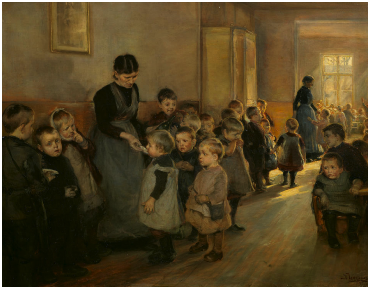
Fig. 17. Knud Erik Larsen, Fra børneasylet på Blegdamsvej. Børnene skal have levertran . 1891, olie på lærred, 76 x 97 cm, privateje.