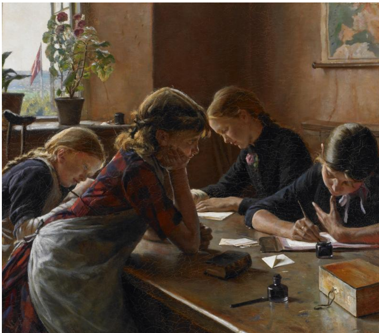
Fig. 14. Valdemar Irminger, Brevskrivning søndag formiddag . Fra Refsnæs Børnehospital. 1889, olie på lærred, 69,5 x 61,5 cm, BRANDTS, FKM/193.

Der var et stort fokus i perioden på tuberkulose, idet en tredjedel af alle dødsfald i den arbejdsduelige del af befolkningen i alderen 15-60 år skyldtes denne sygdom. 45 Vigtigheden af at bekæmpe tuberkulose blev også formidlet i samtidens aviser og tidsskrifter, hvilket var med til at øge støtten til eksempelvis oprettelse af Kysthospitalet og sanatorier. 46 Kysthospitalet der var opført med økonomisk hjælp fra fondstilskud, tilskud fra staten, forskellige kommuner og institutioner samt private donationer blev så populært, at det i 1880 måtte afvise patienter fordi der ikke var plads, ligesom hospitalet blev udvidet flere gange i løbet af 1890'erne og fik bedre faciliteter for både patienter og personale. 47