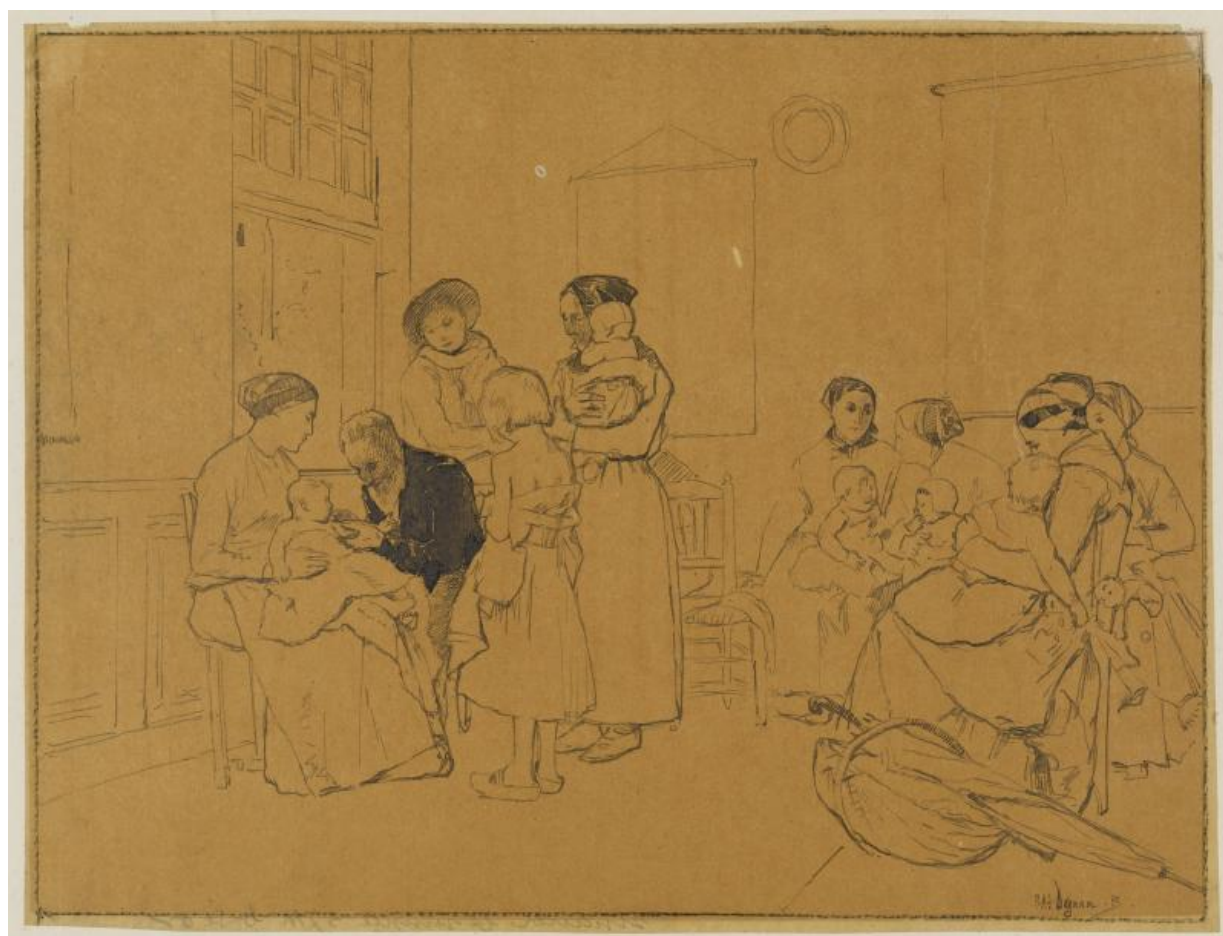
Fig. 10. Pascal Dagnan Bouveret, Vaccinationen af børnene .