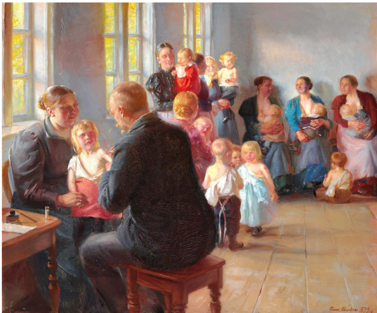
Fig. 1. Anna Ancher, En vaccination . 1899, olie på lærred, 73 x 90 cm, Skagens Kunstmuseer, SKM1944.

Men hvad sker der, hvis man i stedet for at tolke Anna Anchers værk som et lys- og farveeksperiment sætter det ind i en kontekst, hvor fokus i stedet er på samtidige skildringer af sundhedsfremmende tiltag? Med udgangspunkt i Anna Anchers En vaccination og en undersøgelse af, hvordan værket blev modtaget i sin samtid, samt hvordan det bliver opfattet i den nyeste forskning, ser denne artikel nærmere på, hvordan sundhedsfremmende- og forebyggende fremskridt blev skildret i dansk kunst i slutningen af 1800-tallet. Jeg vil argumentere for, at Anna Ancher med sit vaccinationsbillede indskriver sig i et billedfelt, hvor det også drejer sig om at skildre børn, der indgår som en væsentlig del af fortællingen om folkets sundhed, og gøre rede for hvordan børnene som repræsentanter for den kommende generation er særdeles vigtige i den fortælling.