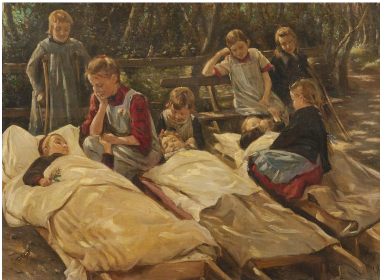
Fig. 13. Valdemar Irminger, Fra Kysthospitalet på Refsnæs . ca. 1888, olie på lærred, 66,5 x 89,5 cm, Museum Sønderjylland, AABMSK1662.