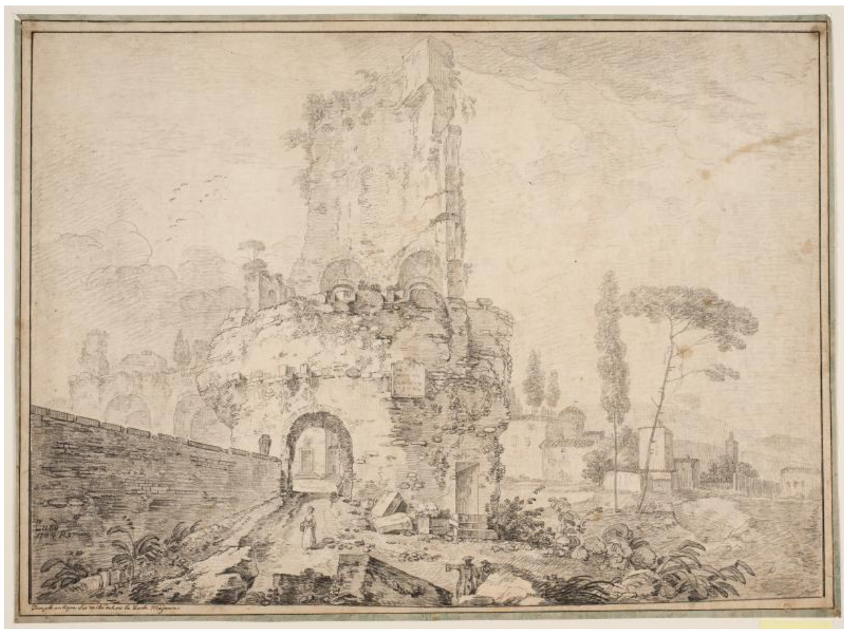
Fig. 4. J.P. Lund: Landskab med ruiner udenfor Rom . 1764. Blyant og sortkridt. 430 x 581 mm. Den kgl. Kobberstiksamling, KKSgb8698. Købt til Kunstakademiet på J.F. Clemens' auktion i 1832; overdraget til Den kgl. Kobberstiksamling i 1845.

sig som potentiel hovedsamling for dansk tegnekunst. Akademiet fortsatte derfor en tid med at indkøbe danske tegninger, og på kobberstikker J.F. Clemens' auktion den 1. maj 1832 indkøbtes således en gruppe gode tegninger af J.P. Lund, Abildgaard, Clemens, Juel og andre, 22 [fig. 3-4] Inden årtiets udgang var Kunstakademiet dog også på dette punkt blevet sejlet agterud.