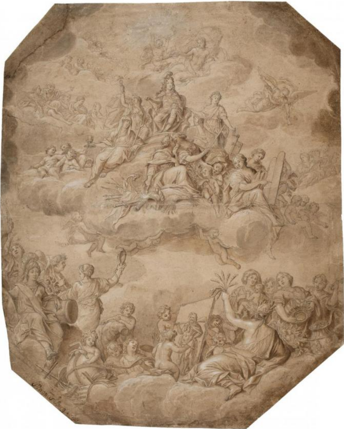
Fig. 7. Magnus Berg: Christian 5.'s apoteose . Pen og sort blæk, brun laving, forhøjet med hvidt. 639 x 515 mm. Den kgl. Kobberstiksamling, KKSgb8759. Købt med J.C. Spenglers samling i 1840.

Spenglers danske samling omfattede mere end 1.700 blade og var anlagt som et historisk overblik over knap tre hundrede års tegnekunst, fra Melchior Lorck [bl.a. fig. 6] til C.W.