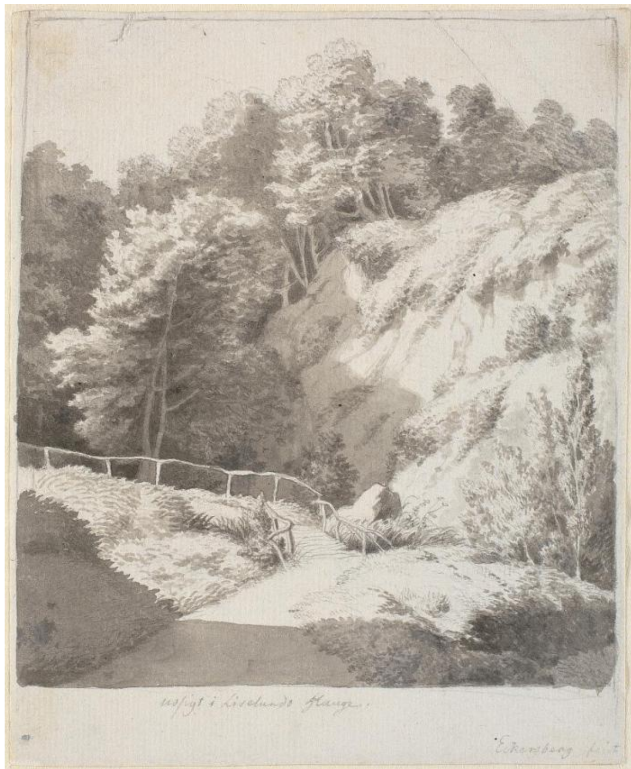
Fig. 2. C.W. Eckersberg: Udsigt i Liselunds have . Ca. 1809. Blyant, pen og blæk samt lavering. 191 x 155 mm. Den kgl. Kobberstiksamling, KKSgb4042. Købt til Kunstakademiet på Johan Bülow's auktion i 1829; overdraget til Den kgl. Kobberstiksamling i 1845. Statens Museum for Kunst, public domain, SMK. Med bibliotekschefens forslag og bibliotekarens umiddelbare billigelse havde Kunstakademiet altså fået stillet en væsentlig kunstnerisk gave i udsigt - omend man risikerede at skulle betale for den. Denne chance ville akademiforsamlingen næppe lade gå fra sig, og det lader til, at man arbejdede i kulissen, for at overdragelsen skulle blive gennemført. Sandsynligvis som argument for at de

bibliotekets chef, gehejmestatsminister Ove Malling (1748-1829), og havde i Werlauffs øjne den fordel, at biblioteket rimeligvis skulle kompenseres økonomisk af akademiet. I 1828 åbnedes derfor officielt forhandlinger med Kunstakademiet om salg af samlingen. 15