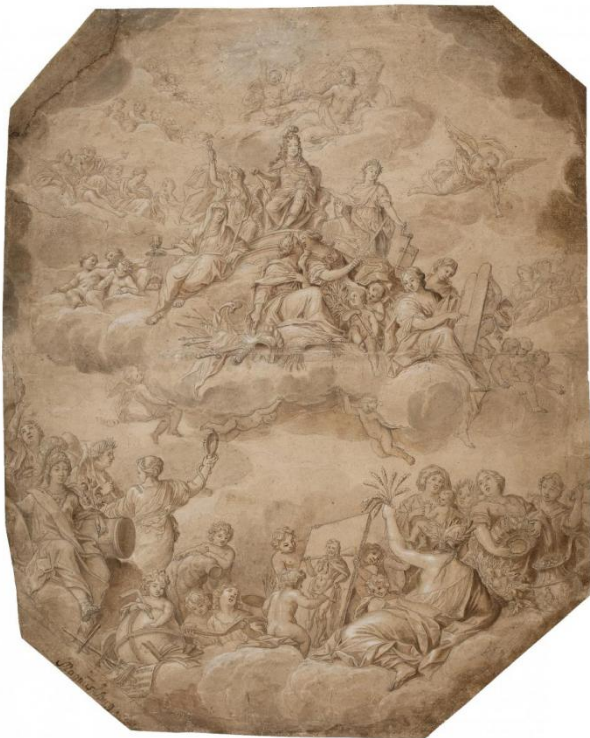
Fig. 7. Magnus Berg: Christian 5.'s apoteose . Pen og sort blæk, brun laving, forhøjet med hvidt. 639 x 515 mm. Den kgl. Kobberstiksamling, KKSgb8759. Købt med J.C. Spenglers samling i 1840. Statens Museum for Kunst, public domain, SMK.

Spenglers danske samling omfattede mere end 1.700 blade og var anlagt som et historisk overblik over knap tre hundrede års tegnekunst, fra Melchior Lorck [bl.a. fig. 6] til C.W.