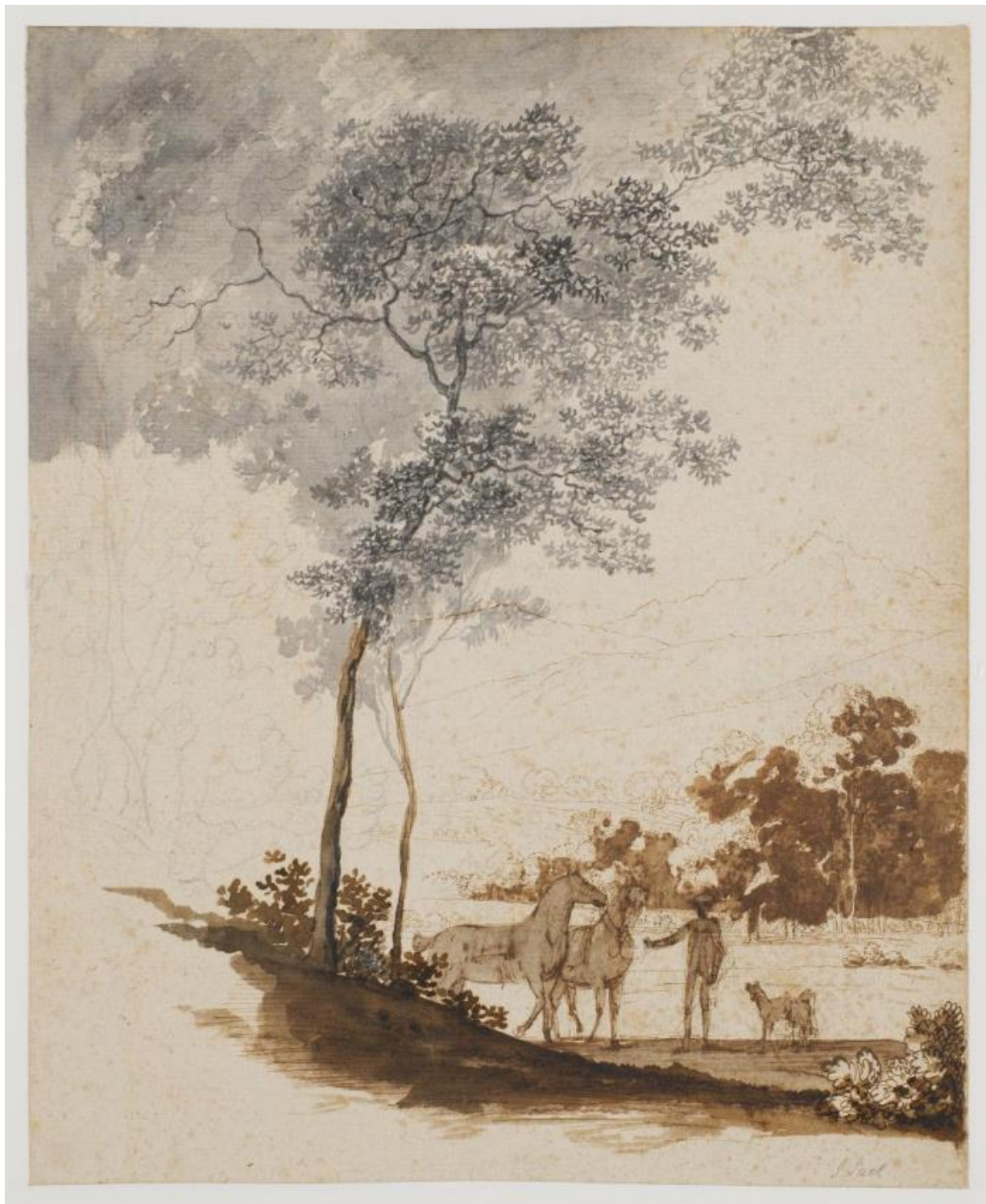
Fig. 9. Jens Juel: Schweizerlandskab med en rideknægt holdende to heste og et par hunde; studie til portræt af Jean-Armand Tronchin . Ca. 1779. Sortkridt, pen og blæk samt tuschlivering på grunderet papir. 347 x 285 mm. Den kgl. Kobberstiksamling, KKSgb5356. Købt med J.C. Spenglers samling i 1840. Statens Museum for Kunst, public domain, SMK.