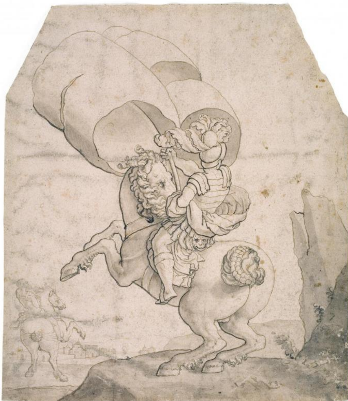
Fig. 6. Melchior Lorck: To ryttere, den forreste bærende en fane . 1553. Pen og blæk samt grålig lavering. 264 x 231 mm. Den kgl. Kobberstiksamling, KKSgb5460. Købt med J.C. Spenglers samling i 1840. Statens Museum for Kunst, public domain, SMK.

Spenglers samlinger fandtes ganske vist en del ældre blade, der med rimelighed kunne regnes med til den danske skole. Fra sidstnævnte samling kunne Thiele bl.a. udtage en snes tegninger af tilrejsende kunstnere som Heinrich Dittmers (1625-77), Jacob d'Agar (1642-1715) og Benoit le Coffre (1671-1722), 28 blade af Mandelberg, otte af J.P. Lund samt yderligere en snes blade af Spenglers gode ven, den tyskfødte Marcus Tuscher. [fig. 5] Men derudover var det, hvad tegninger angik, vanskeligt at tale om en dansk afdeling af den nystiftede institution. Værst stod det til med repræsentationen af tegninger fra perioden efter 1750, og det blev en af Thieles højeste prioriteter at råde bod på denne lakune.