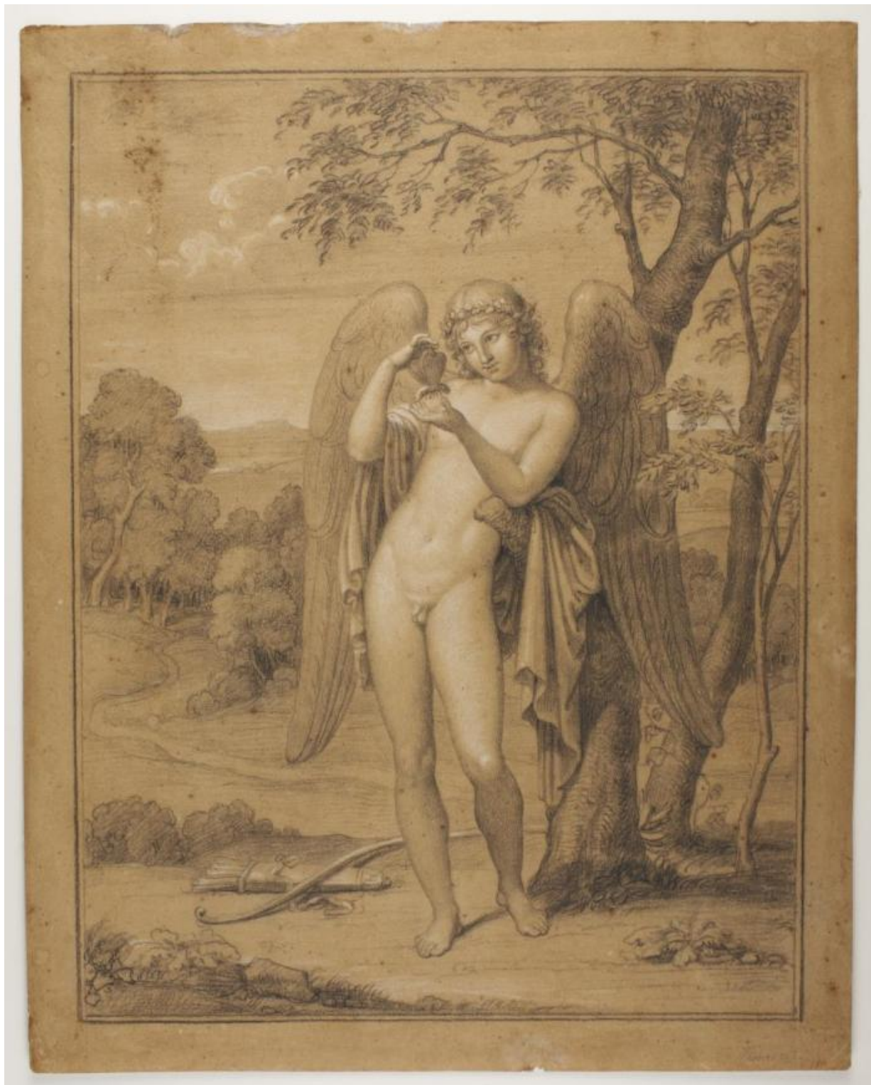
Fig. 13. Bertel Thorvaldsen: Amor leger med en sommerfugl . Ca, 1805-10. Sort kridt forhøjet med hvidt på lyst brunt papir. 421 x 333 mm. Den kgl. Kobberstiksamling, deponeret i Thorvaldsens Museum, Dep. 7. Købt af J.C. Spengler på Bülow's auktion i 1829 og indgået med Spenglers samling i 1840. Statens Museum for Kunst, public domain, SMK.

Mens Kunstakademiets tidlige tilløb til at skabe en offentlig samling af nationens tegnekunst altså snart forsvandt i glemelsen, så havde Kobberstiksamlingen ved indgangen til 1840'erne fuldstændig overtaget rollen som hovedsamling af danske tegninger. Blandt kunstnere blev den tanke snart helt naturlig, at deres skitser og studier kunne være af national betydning og institutionel interesse. Så da Johan Thomas Lundbye forud for sin store udlandsrejse i 1845 gjorde sig tanker om sit jordiske gods, var det oplagt for ham at ønske: "Tegningerne maatte ikke skilles ad, saafremt de kunde optages i en eller anden offentlig Samling." 55