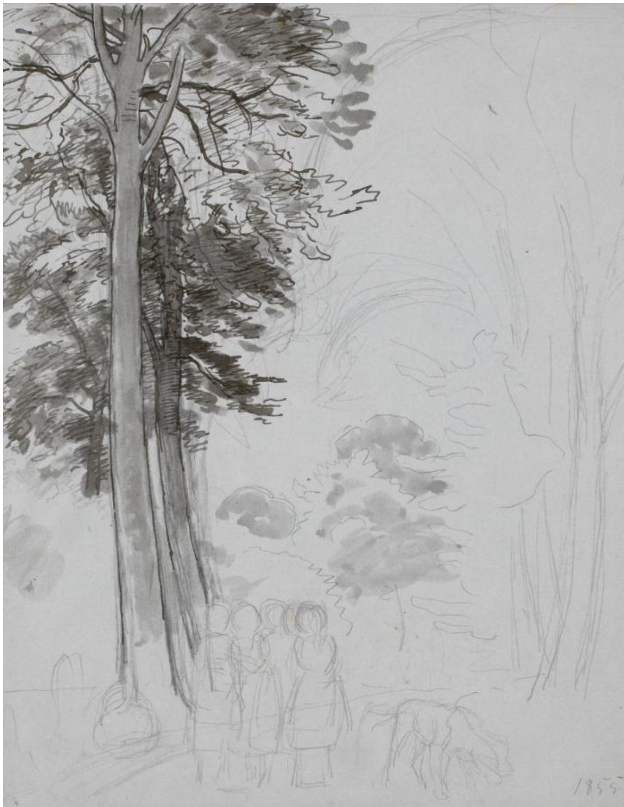
Fig. 9. P.C. Skovgaard: Studie til "Bøgeskov i Maj" , 1855. Blyant, pen, gråt blæk, pensel og grå lavering på blåt papir. 281 x 234 mm. Den kgl. Kobberstiksamling, Statens Museum for Kunst, inv.nr. KKS21421, public domain, SMK.