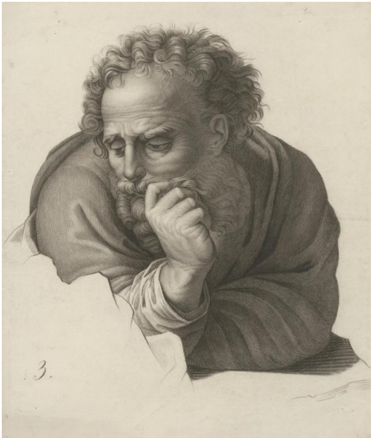
Fig. 3. P.C. Skovgaard, Apostelhoved, u.å. Blyant på papir. 409 x 346 mm. Danmarks Kunstbibliotek.