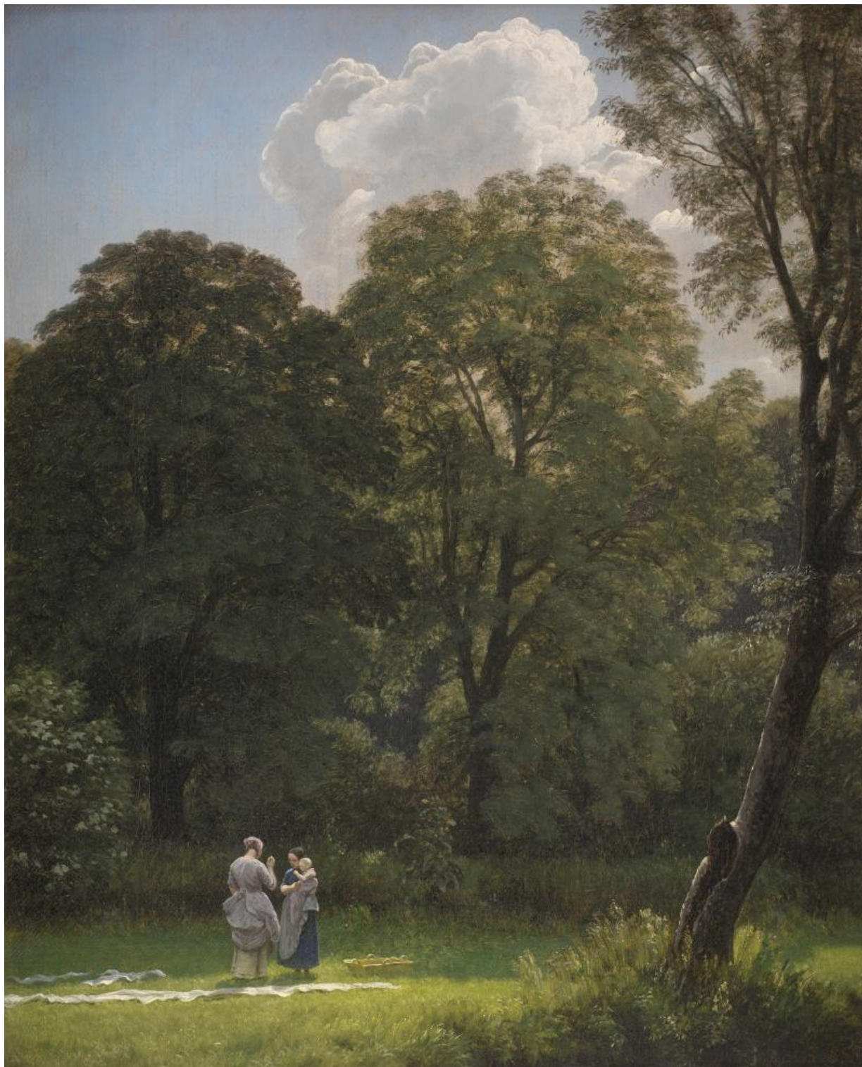
Fig. 6. P.C. Skovgaard: Blegeplads under store træer , 1858. Olie på lærred. 44,5 x 36,5 cm. Statens Museum for Kunst, inv.nr. KMS3772, public domain, SMK. Én tegning gjorde det dog sjældent alene, når Skovgaard skulle male sine endelige billeder. Maleriet Bøgeskov i maj. Motiv fra Iselingen fra 1854 [fig. 7] krævede flere tegnede studier, og tegningerne blev således anvendt som puslespilsbrikker til et større maleri. I det her omtalte værk arbejdede Skovgaard med skoven som en slags scene for familieportrættet og lod scenen bygge op omkring en sti, der snor sig gennem skovens ranke, himmelstræbende bøgetræer. I en af tegningerne anes i forgrunden fem skikkelser og en hund, der ser ind i billedet. [fig. 8] Der er ingen detaljer i hverken ansigter, tøj eller landskab. Alt er blot hurtigt skitseret, så vi fornemmer personernes mulige placering i forhold til hinanden. Det giver en helt anden effekt, når Skovgaard i en anden tegning har tegnet træerne i venstre side af billedet op med tusch, gråt blæk og laving, da det skaber mere dybde og rumfornemmelse i billedet. [fig. 9] Gruppen på fem er svundet ind til fire, og hundens fokus er flyttet, så den nu står og kigger ned i græsset. I en tredje tegning er det skoven, der har