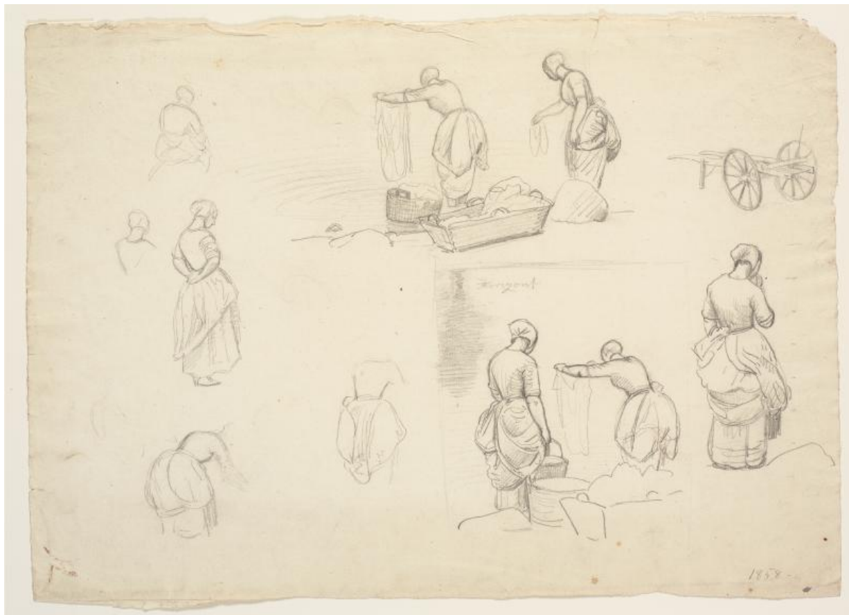
Fig. 4. P.C. Skovgaard: Syv detailstudier samt to studier til maleriet: "Vaskekoner ved Bondedammen i Hellebæk". 3. august 1838. Blyant. Blyant på papir. 346 x 482 mm. Den kgl. Kobberstiksamling, Statens Museum for Kunst, inv.nr. KKS21427.