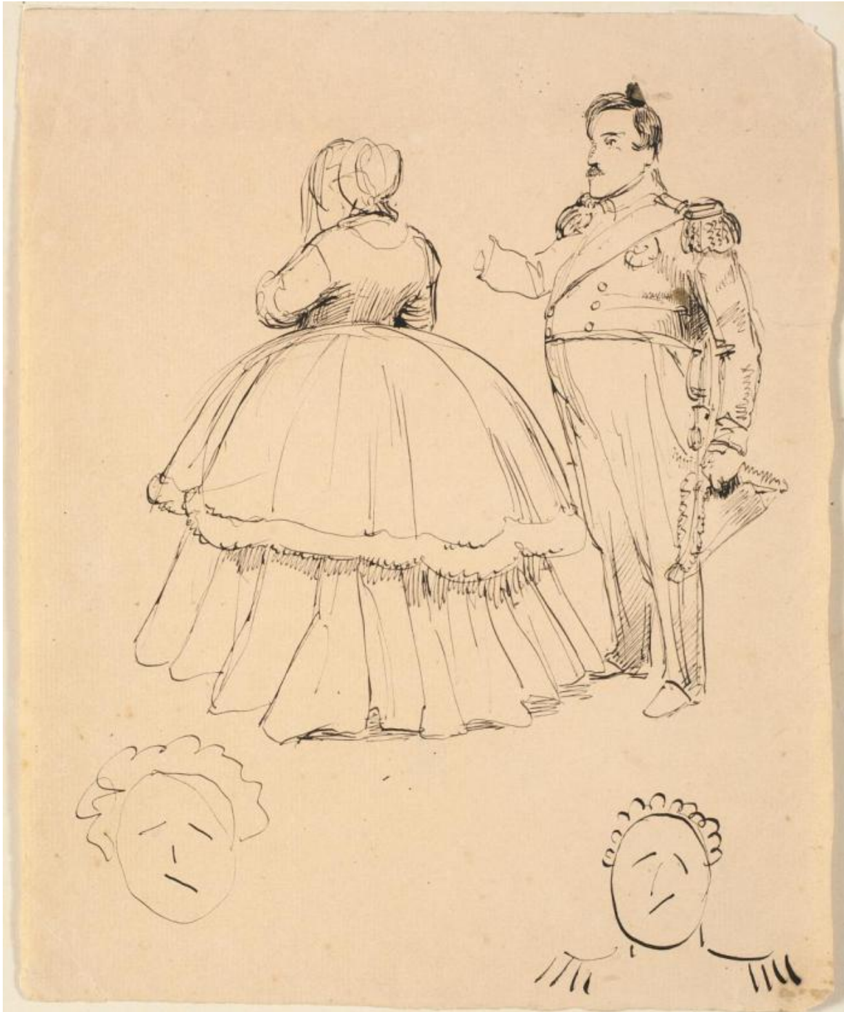
Fig. 25. P.C. Skovgaard: Karikatur af Frederik VII og Grevinde Danner; forneden af Christian VIII . 1840'erne. Pen og sort blæk. 215 x 176 mm. Den kgl. Kobberstiksamling, Statens Museum for Kunst, inv.nr. KKS9304, public

Frederik VII (1808-1863), der også bevæger sig i retningen af det komiske. I en af tegningerne ses Christian VIII portrætteret i to udgaver begge med krøllet hår og skæve øjne. På det ene har han fået epauletter på skulderne. Efter to forliste og barnløse ægteskaber udnyttede Frederik VII sin popularitet efter indstiftelsen af Junigrundloven i 1849 og giftede sig med modehandlerske Louise Rasmussen (1815-1874), der ved en såkaldt kongelig resolution blev ophøjet til Grevinde Danner. Hun optræder også på tegningen og er skildret rygvendt iført en meget stor, fyldig kjole. Frederik VII genkendes på sit karakteristiske overskæg og er iklædt fuldt antræk med orden, epauletter på jakken og hatten i venstre hånd.