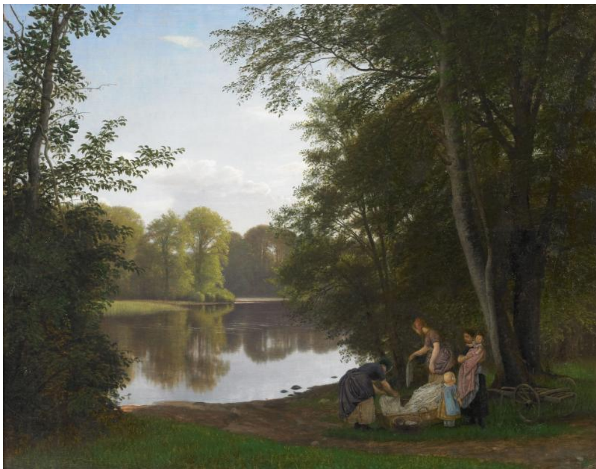
Fig. 5. P.C. Skovgaard, Stille sommeraften ved en Indsø. Bondedammen i Hellebæk, unge mødre vasker tøj , ca. 1857-60. Olie på lærred. 80 x 100 cm. Skovgaard Museet, inv.nr. 19.469.