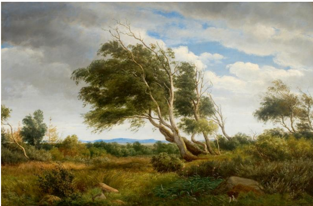
Fig. 14. P.C. Skovgaard: Parti af udkanten af Tisvilde skov , 1845.olie på lærred. 89 x 137 cm. Skovgaard Museet, inv.nr. 10.175.

Joakim beskriver i citatet den farvelagte tegning som en "juvel" med en særlig "sølvtone" og bemærker, at blæsten ses tydeligere i tegningen end i maleriet. Her har han udnyttet synligheden af pennens konturer, der angiver de af vinden hældende græsstrå, blade og grene, der fortsat er synlig under vandfarven. I maleriet er den livlighed, som ses i den nederste del af tegningen, mindre synlig og bevægelsen her er i høj grad formet af skyerne, der driver over himlen og de vindblæste træer i midten. De to eksempler viser, at Skovgaard måtte give afkald på nogle interessante virkninger, som kun tegningen tillod ham at lave. De forsvandt med olien. Joakim beskriver i citatet den farvelagte tegning som en "juvel" med en særlig "sølvtone" og bemærker, at blæsten ses tydeligere i tegningen end i maleriet. Her har han udnyttet synligheden af pennens konturer, der angiver de af vinden hældende græsstrå, blade og grene, der fortsat er synlig under vandfarven. I maleriet er den livlighed, som ses i den nederste del af tegningen, mindre synlig og bevægelsen her er i høj grad formet af skyerne, der driver over himlen og de vindblæste træer i midten. De to eksempler viser, at Skovgaard måtte give afkald på nogle interessante virkninger, som kun tegningen tillod ham at lave. De forsvandt med olien.