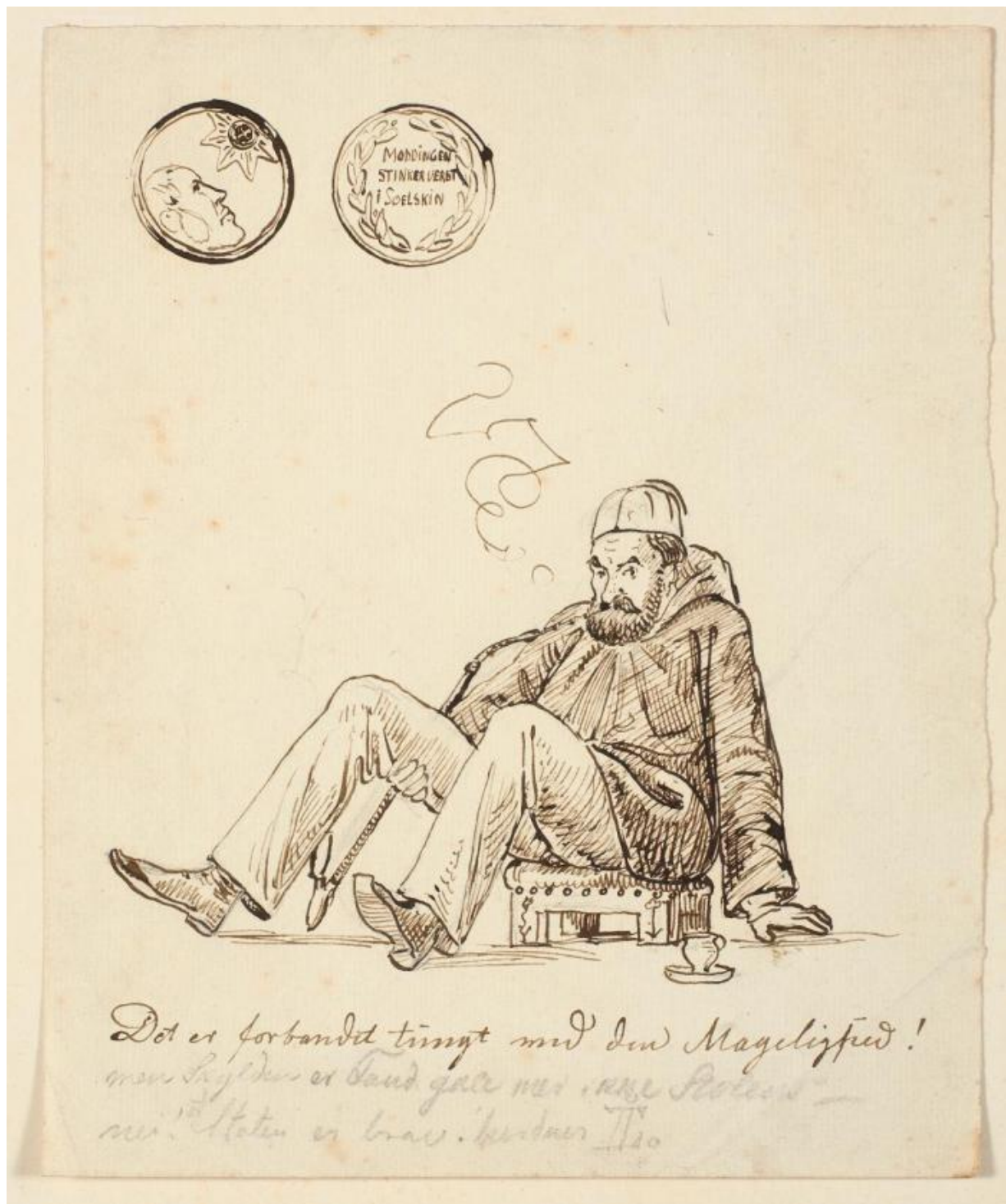
Fig. 24. P.C. Skovgaard: Karikatur af Johan Thomas Lundbye med fez, lang pibe og kaffekop, siddende paa en orientalsk skammel. Foroven medalje med inskriptionen "Møddingen stinker verst i soelskin" og forneden humoristisk indskrift. Før 1848. Blyant, pen og brunt blæk. 220 x 179 mm. Den kgl. Kobberstiksamling, Statens Museum for Kunst, inv.nr. KKS9303

De komiske tegninger rummer endnu et element, nemlig inskriptioner eller påskrifter, der understreger tegningens visuelle udtryk og indhold. På et portræt af Johan Thomas Lundbye siddende på en orientalsk skammel med fez, lang pibe og kaffekop ses en medalje med teksten: "Møddingen stinker verst i Soelskin" og forneden en humoristisk indskrift: "Det er forbandet tungt med den Magelighed". [fig. 24]