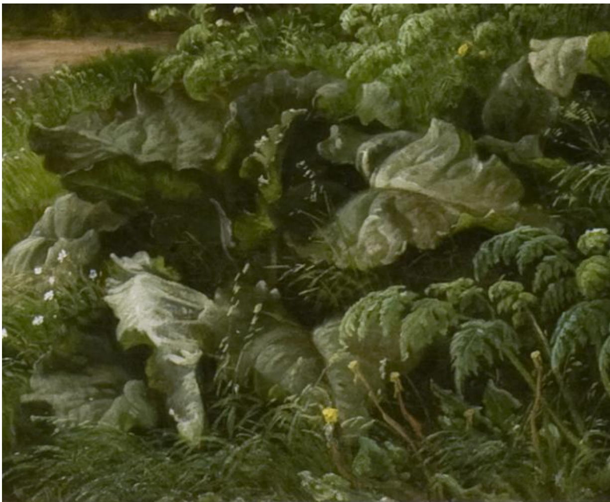
Fig. 13. Detalje af P.C. Skovgaard, Bøgeskov i Maj. Motiv fra Iselingen , 1857. Statens Museum for Kunst. Se fig. 7.

været flink til at datere sine mindre billeder ret præcist, hvilket giver os en fornemmelse af, hvornår og hvor han har været. Det samme er tilfældet for tegningerne, der således får form af et visuelt dagbogsnotat. Tilblivelsen af Skovgaards afgangsværk fra akademiet er et fint eksempel på det: På en rejse i sommeren 1843, ofte omtalt som "Sommerrejsen", fandt han motivet til det, der to år senere skulle blive hans afgangsværk, nemlig Parti fra udkanten af Tisvilde Skov . 32 [fig. 14] I en skitsebog dateret 13. juni 1843 fremgår det, at Skovgaard sad et sted i udkanten af Tisvilde Hegn [fig. 15] og med blyant skitserede omridset af et kroget, forblæst birketræ og dele af den bevoksning, der udgør det færdige billedes mellemgrund. Jordbunden med planter og grantræer er ridset op med krydsskraverede streger. Forgrunden prydes af detaljerede plantestudier og kampesten, mens et fladt marklandskab løber ud i horisonten i baggrunden og brydes af en ny skovbevoksning i det fjerne. Gråchangerende skyer giver himlen et dynamisk, næsten faretruende udtryk, hvilket gør det vanskeligt at bedømme, om det trækker op til storm, eller stormen er ved at drive bort. Papirværkerne har en på en gang mildere tone men er også mere dramatiske i udtrykket, end det færdige maleri, hvilket skyldes brugen af blyant, pen, tusch og vandfarve. [fig. 16] Sønnen Joakim har beskrevet maleriet og et studie til det på følgende måde: