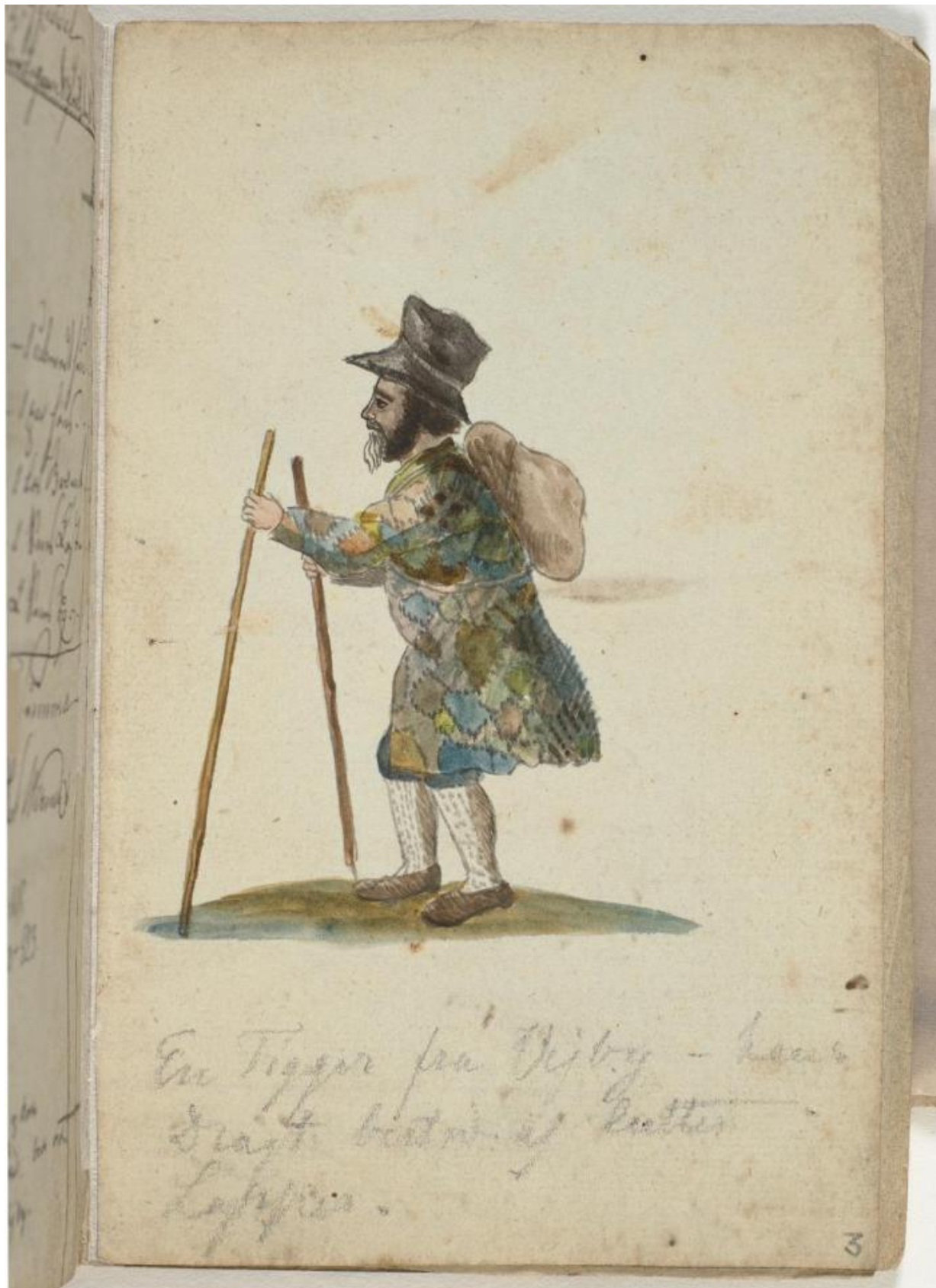
Fig. 18. P.C. Skovgaard: En gående mand i en meget spraglet frakke, med en bylt på ryggen. Han har en stok i hver hånd. Ca. 1828. Blyant, pensel og vandfarve. Den kgl. Kobberstiksamling, Statens Museum for Kunst, inv.nr. KKS1960-824

Skovgaard blev betaget af kvindernes traditionelle dragt med sort nederdel og vest og med et stort hvidt tørklæde om hovedet og halsen til at skærme mod vejr og vind. Han fik gengivet, hvordan kvinden over en hvid skjorte bar en vest med knapper af sølv, der på papiret er vist som små runde, hvide cirkler. Han har udført tegningen med blyant, pen, sortblæk og farvelagt med vandfarve og på