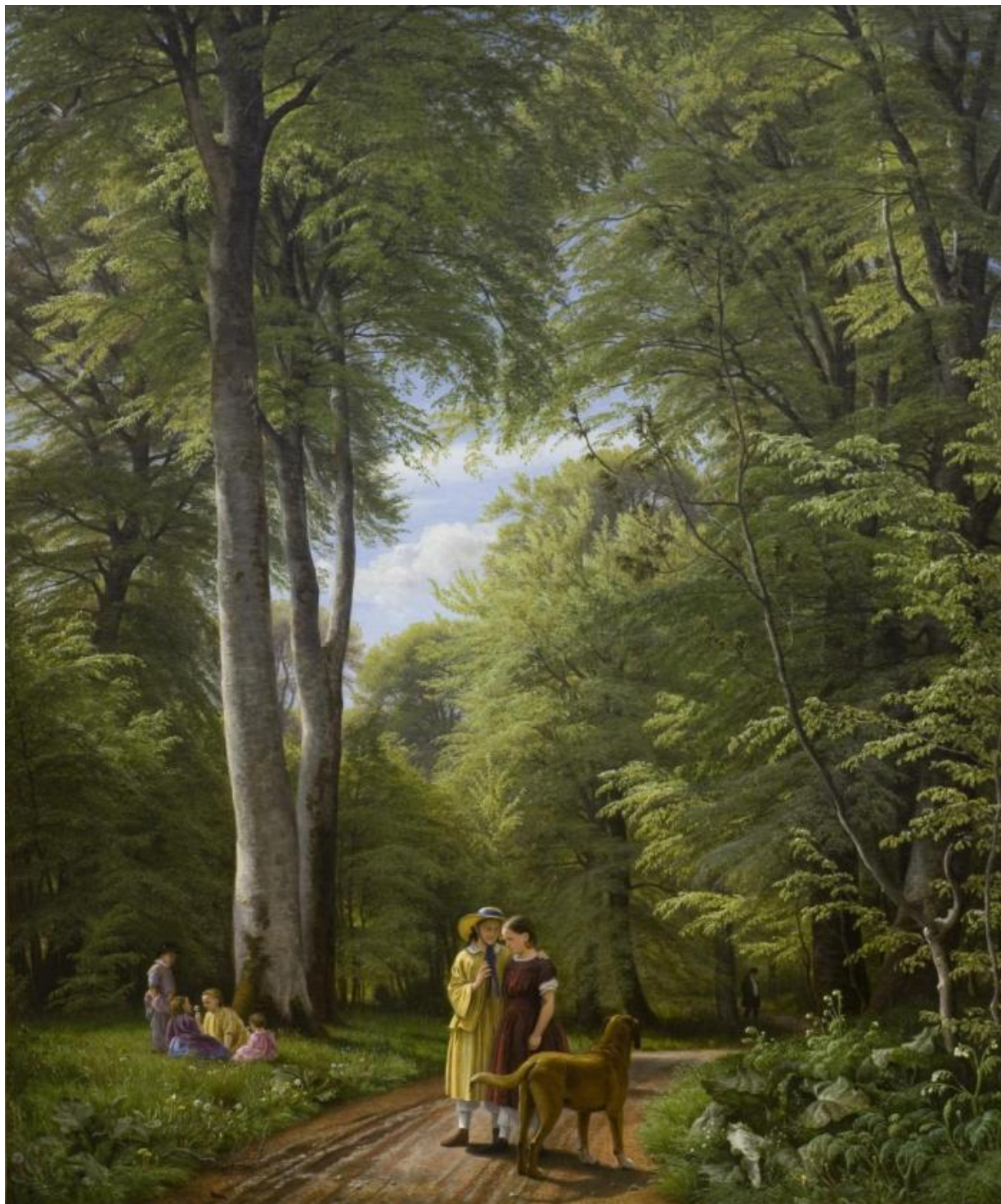
Fig. 7. P.C. Skovgaard: Bøgeskov i Maj. Motiv fra Iselingen , 1857. Olie på lærred. 214,1 x 183,1 cm. Statens Museum for Kunst, inv.nr. KMS4580, public domain, SMK.

Skovgaards fulde opmærksomhed. Træerne er tegnet med en tyk tusch og lys og skygger er skraveret med varierende kraft alt efter, hvor mørke skyggerne skulle være. Længere inde ad stien anes et menneske. [fig. 10]