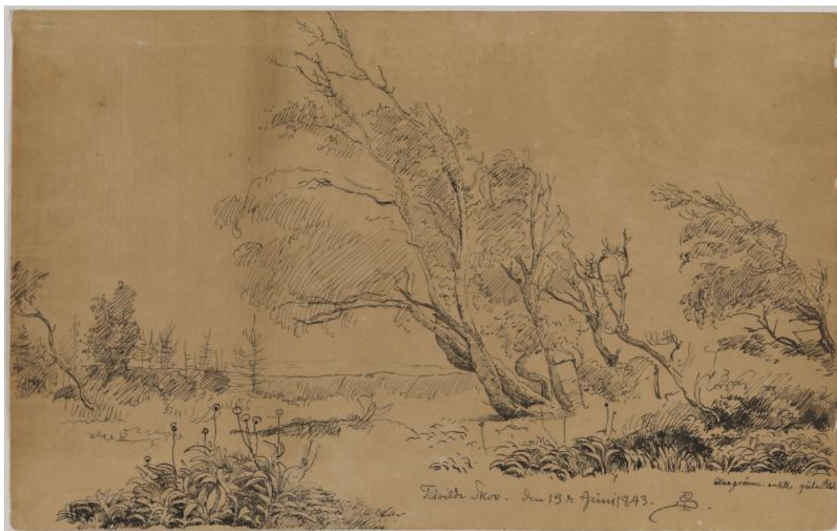
Fig. 15. P.C. Skovgaard: Tisvilde skov . 13. juni 1843. Pen på papir. 21,6 x 34,5 cm. Nationalmuseum Stockholm. inv.nr. NMH 104/1963.