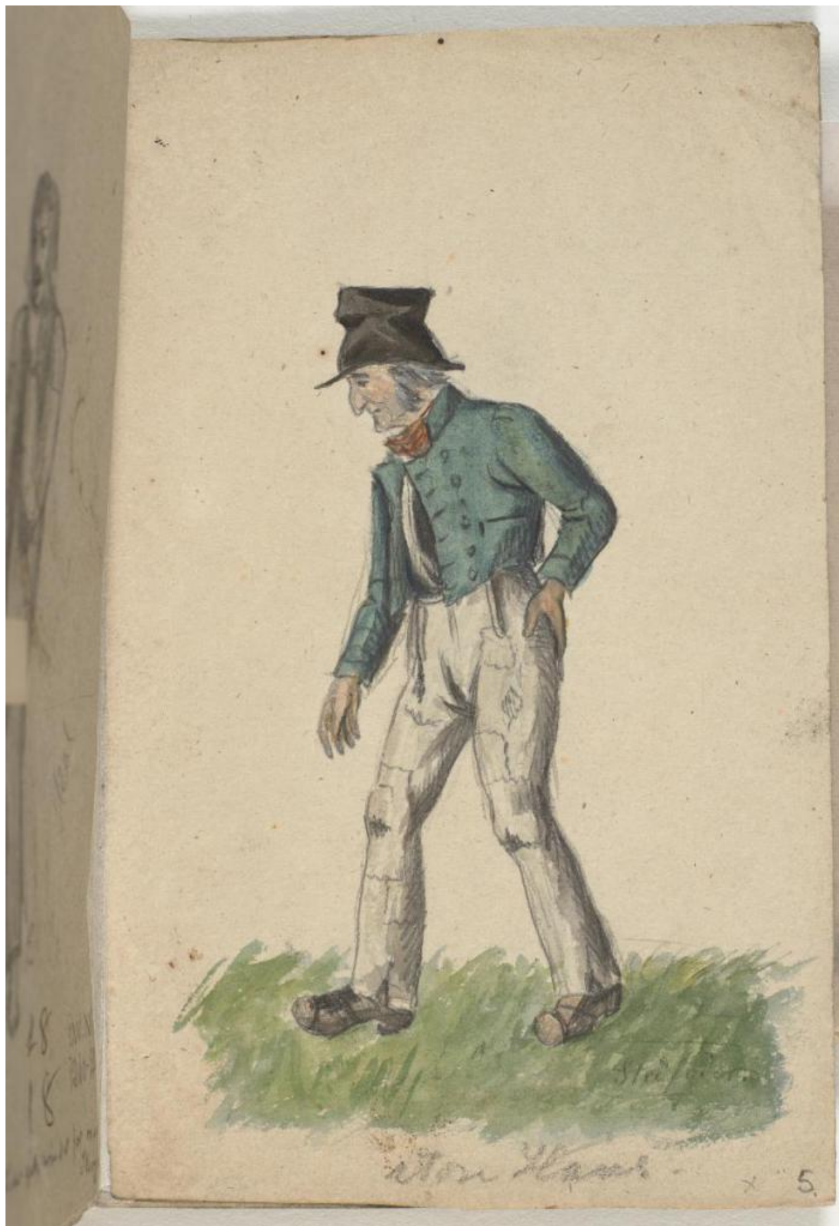
Fig. 17. P.C. Skovgaard: En gående mand med meget lappede bukser, kort jakke og høj hat. 1826-1829. Blyant, pensel, vandfarve og dækfarve. Den kgl. Kobberstiksamling, Statens Museum for Kunst, inv.nr. KKS1960-826, public domain, SMK.