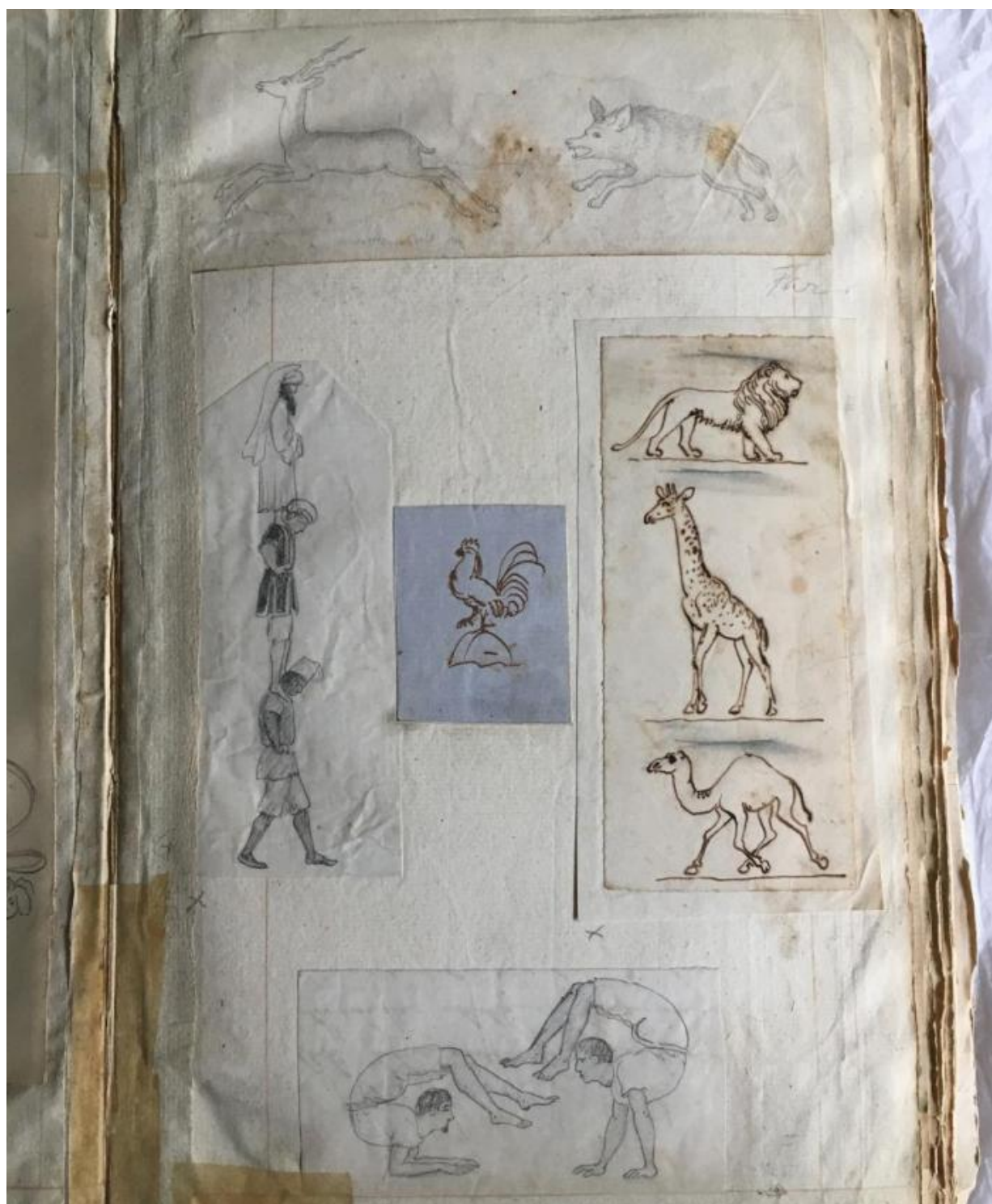
Fig. 2. Susette Holtens scrapbog. Skovgaard Museet. To tegnebøger i samlingen på ARoS, der stammer fra slutningen af 1820'erne eller begyndelsen af 1830'erne, er også fyldt med plantestudier, dyr og huse, landskabs- og naturtegninger og tegninger med borge og riddere. Skovgaard har også tegnet helfigursportrætter af adelsmænd, der, efter deres udtryk at dømme, formodentlig er udført efter kobberstiksforlæg. Tegningerne kan ikke siges at have høj kunstnerisk kvalitet, men de bidrager til et indtryk af de evner, Skovgaard gjorde sig bemærket med i en ung alder. Tegningerne er præget af et eventyrligt univers, som man vel vil

er på i alt 89 sider, og i den første del har Skovgaard med sirlig håndskrift skrevet korte tekster, der senere har fået lærerens bedømmelse "Godt", "Meget godt" etc. Et stykke inde i bogen ændrer siderne dog karakter, og tegninger af dyr, mennesker, huse og blomster, der ikke er tænkt som illustrationer til teksterne, breder sig ud over hele sider eller rundt om teksterne. [fig. 1]