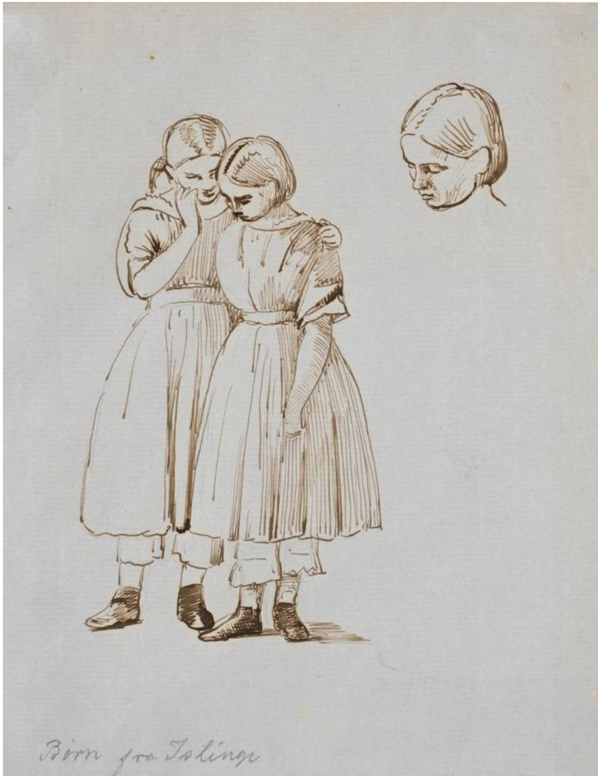
Fig. 11. P.C. Skovgaard: Studie til de to pigebørn samt til hende (t.h.'s) hoved på billederne "Bøgeskov i Maj" . 1857. Blyant, pen og brunt blæk på falmet blåt papir. 248 x 218 mm. Den kgl. Kobberstiksamling, Statens Museum for Kunst, inv.nr. KKS21422, public domain, SMK.