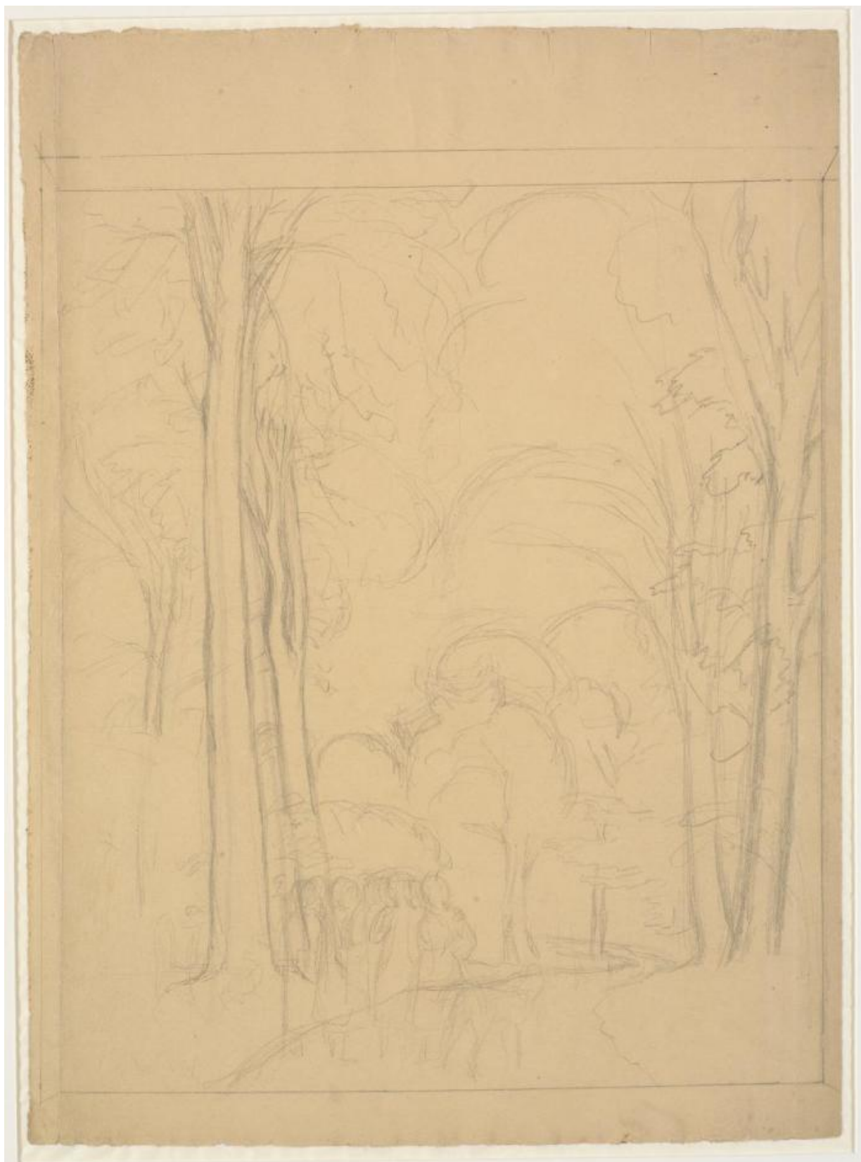
Fig. 8. P.C. Skovgaard: Studie til "Bøgeskov i maj" , ca. 1857. Blyant på brungult papir. Omrammet af blyant, 490 x 355 mm. Den kgl. Kobberstiksamling, Statens Museum for Kunst, inv.nr. KKS21420, public domain, SMK.

Ved at betragte tegninger som disse kommer vi helt ned i kunstnerens arbejdsproces, hvor hans forestillinger om motivet får konkret form. Det er selvfølgelig små forandringer, han har foretaget, men de viser, hvordan det færdige maleri blev et resultat af flere undersøgelser og iagttagelser. Tegningerne var så at sige byggesten, som Skovgaard brugte til at finde den rette balance mellem de elementer, som det endelige motiv skulle bestå af.