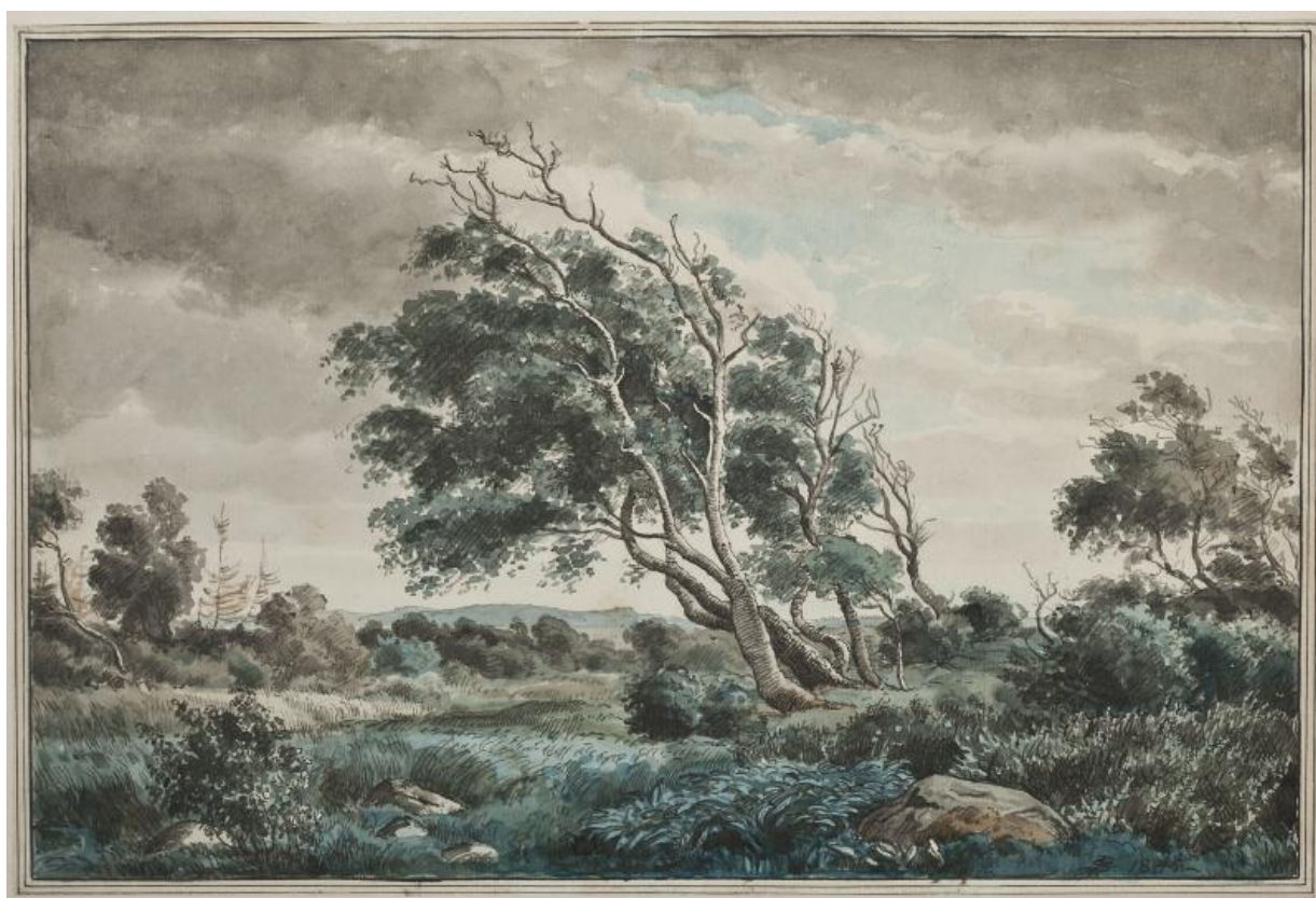
Fig. 16. P.C. Skovgaard: Studie til Parti af udkanten fra Tisvilde Skov. Mellem 1843-1845. Pen, tusch og vandfarve på papir. 265 x 390 mm. Privateje.