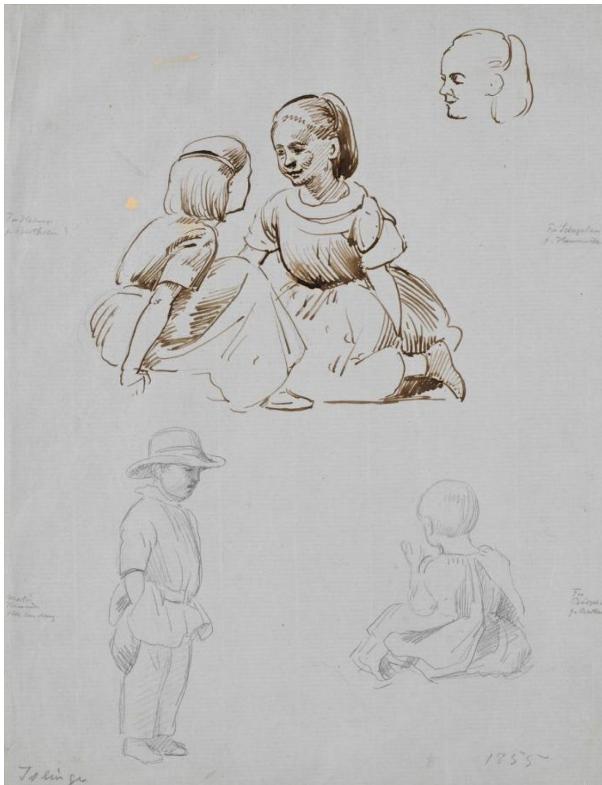
Fig. 12. P.C. Skovgaard: Studier til børnegruppen t.v. på "Bøgeskov i Maj". 1855. Blyant, pen og brunt blæk på falmet blått papir. 278 x 218 cm. Den kgl. Kobberstiksamling, Statens Museum for Kunst, inv.nr. KKS21423

Med andre ord er kunstnerens valg af motiv i høj grad også, eller måske snarere, resultat af en fascination af landskabet i sig selv. Det er ikke tilfældigt, at Skovgaard fandt motiver i for eksempel Tisvilde, hvor han var vokset op. Han kendte jo stedet og havde et forhold til det, hvorfor han også vendte tilbage flere gange, selvom han hele sit voksne liv var bosat i København. Skovgaard har