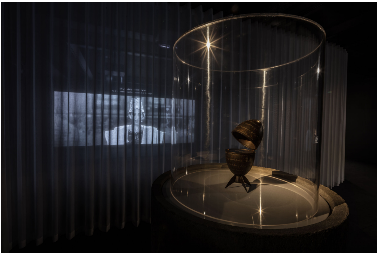
Fig 9. Larissa Sansour & Søren Lind. Archeology in Absentia , 2016. Fifteen 20cm bronze sculptures. Detail.

Hvor hjemløst Tomorrow's Ghosts end måtte være, er der i sidste ende tale om et genopretningsprojekt, der ved at give spøgelse stemme, handleevne og subjektivitet indbyder dem til at tage til orde og svare igen. Disse spøgelse bliver hængende i det palæstinensiske landskab og den palæstinensiske nationalbevidsthed, som de hjemløse; hvordan kan det være anderledes, når så meget ligger uløst hen. Tomorrow's Ghosts tilbyder dem i det mindste et imaginært sted at vende tilbage til. Dette gør i høj grad udstillingen til en øvelse i spektral sameksistens: samvær og samliv med spøgelse. Som demonstreret af Alia i In Vitro går dette ikke