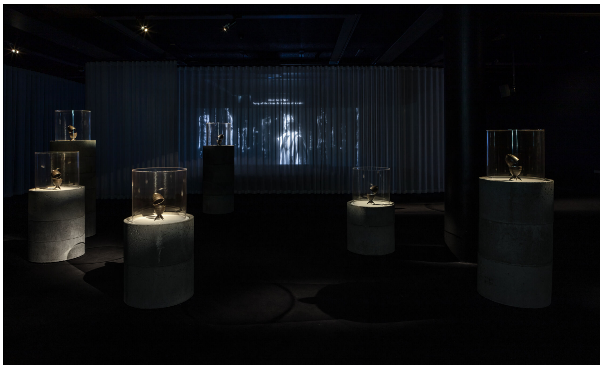
Fig 8. Larissa Sansour & Søren Lind. Archeology in Absentia , 2016. Fifteen 20cm bronze sculptures. Exhibition view.

at det ikke behøver at være sådan. Skulpturrækken, der udstilles som del af Tomorrow's Ghosts , indgår i et større korpus, hvis omdrejningspunkt er science fiction-enkeltkanalsvideoen In the Future They Ate from the Finest Porcelain ("I fremtiden har de spist af det fineste porcelæn", 2016). I denne video lægger en modstandsgruppe udsøgt keffieh-mønstret porcelæn ned i jorden i håb om, at dette service vil blive fundet af arkæologer engang i fremtiden. Det vil da skabe materielt og historisk belæg for eksistensen af et folk, der ganske rigtigt "har spist af det fineste porcelæn". Projektet kommenterer, hvordan arkæologien og helt nøjagtigt den bibelske arkæologi i Israel bruges som våben, når der skal formuleres oprindelsesmyter og rettigheder til jorden, som forbeholdes jøder. 31 I Archaeology in Absentia bliver brugen af arkæologi som våben vendt om og stofliggjort. Installationen består af femten bronzekopier af 20 cm granater, der ligner Fabergé-æg. Hvert af "æggene" rummer en plade, hvor længde- og breddegrad for porcelænsladningens nedgravning i historisk Palæstina er indgraveret [Fig.8]. Skulpturerne bærer da vidnesbyrd om et ikke længere eksisterende Palæstinakorts spøgelsesgeografi, men er samtidig også et forsøg på at kræve det tilbage.