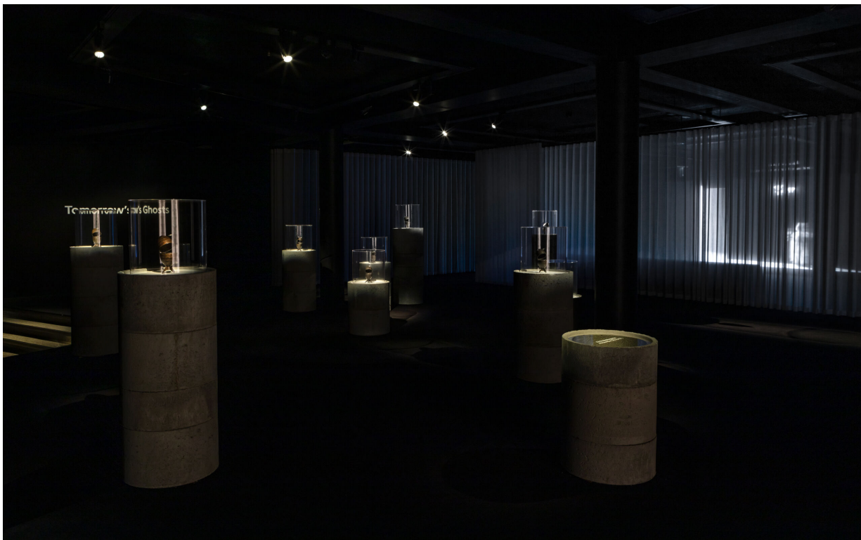
Fig 1. Larissa Sansour & Søren Lind. Tomorrow's Ghosts . Exhibition view. Kunsten, Museum of Modern Art Aalborg, 2023.

udvider denne forestilling og forvandler spøgelse til en livskraft, en nødvendighed for at besjæle fortid, nutid og fremtid. Tidsligheden i udstillingens titel, Tomorrow's Ghosts , kan således aflæses på flere måder: det er lige så meget spøgelse til morgendagen, som det er spøgelse fra morgendagen. Enten spøgelse på denne udstilling nu er en singular figur eller et spøgelsesagtigt motiv, så er det også altid kollektivt og hjem søger os fra fortiden og vedbliver med at gøre det fra fremtiden. Ligesom intergenerationelle traumer frembringer science fiction jagtterræner for hjem søgelsen. De opstår i tidsligheder, som ikke stemmer overens, og som falder sammen og præges af en dyb uro og derfor vedbliver med at frembringe deres egen, ofte modsigelsesfyldte, tidslige logik. Som sådan udvider værkerne på denne udstilling ikke alene forestillingerne om spektralitet og hjem søgthed, om spøgelse og det spøgelsesagtige, vigtigst af alt så redefinerer de dem. I denne artikel undersøger jeg, hvordan dette bliver gjort af såvel de enkelte værker, der udgør udstillingen, som af udstillingen i sin helhed.