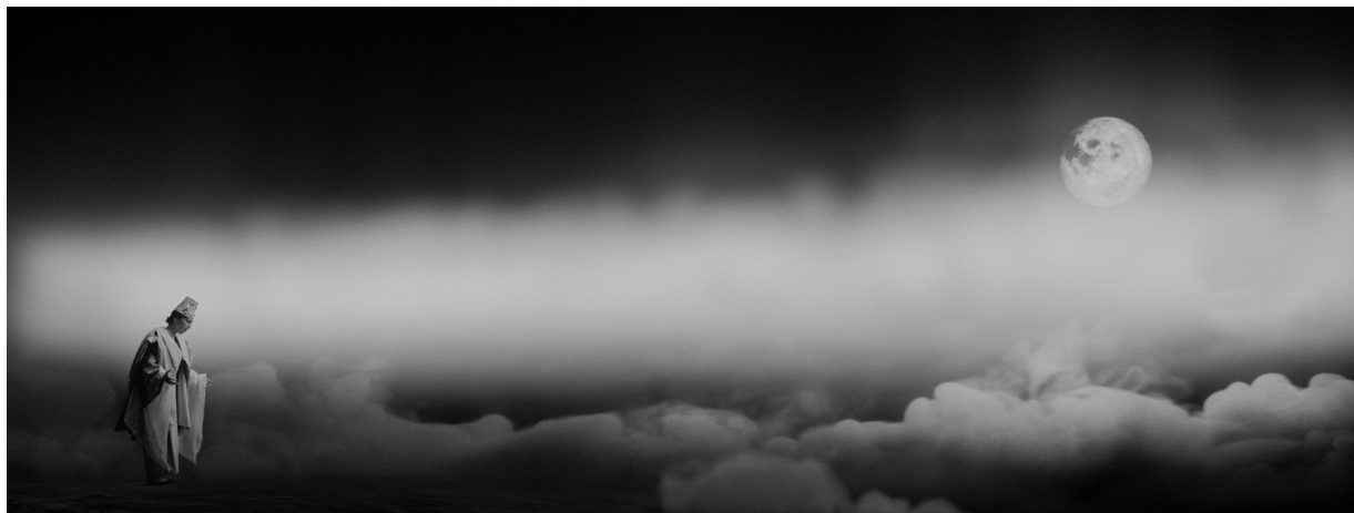
Fig 5. Larissa Sansour & Søren Lind. As If No Misfortune Had Occurred in the Night , 2022. Three-channel HD video installation, 21'. Video still.