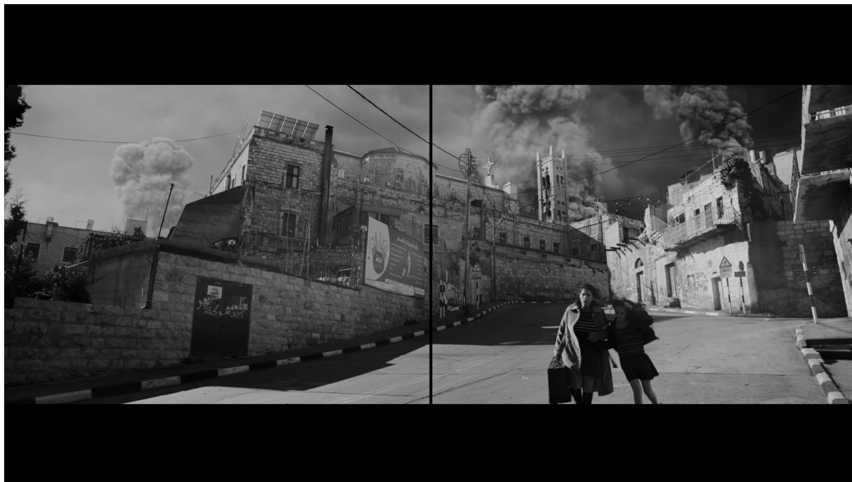
Fig 2. Larissa Sansour & Søren Lind. In Vitro , 2019. Two-channel black and white HD video installation, 27' 44''. Video still.