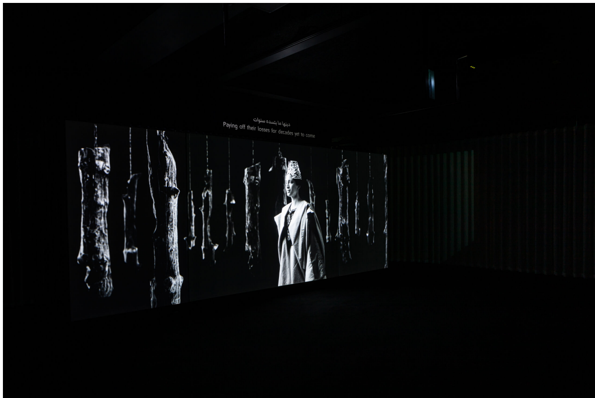
Fig 6. Larissa Sansour & Søren Lind. As If No Misfortune Had Occurred in the Night , 2022. Three-channel HD video installation, 21'. Video still.