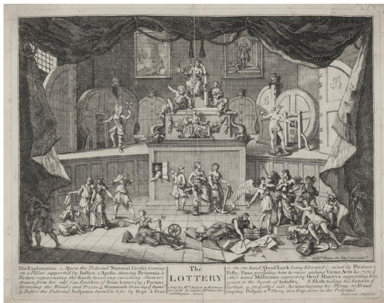
Fig. 9. William Hogarth: Lotteriet, 1721. Radering og kobberstik. 262 x 338 mm. Den kgl. Kobberstiksamling, SMK, inv.nr. KKS5396.