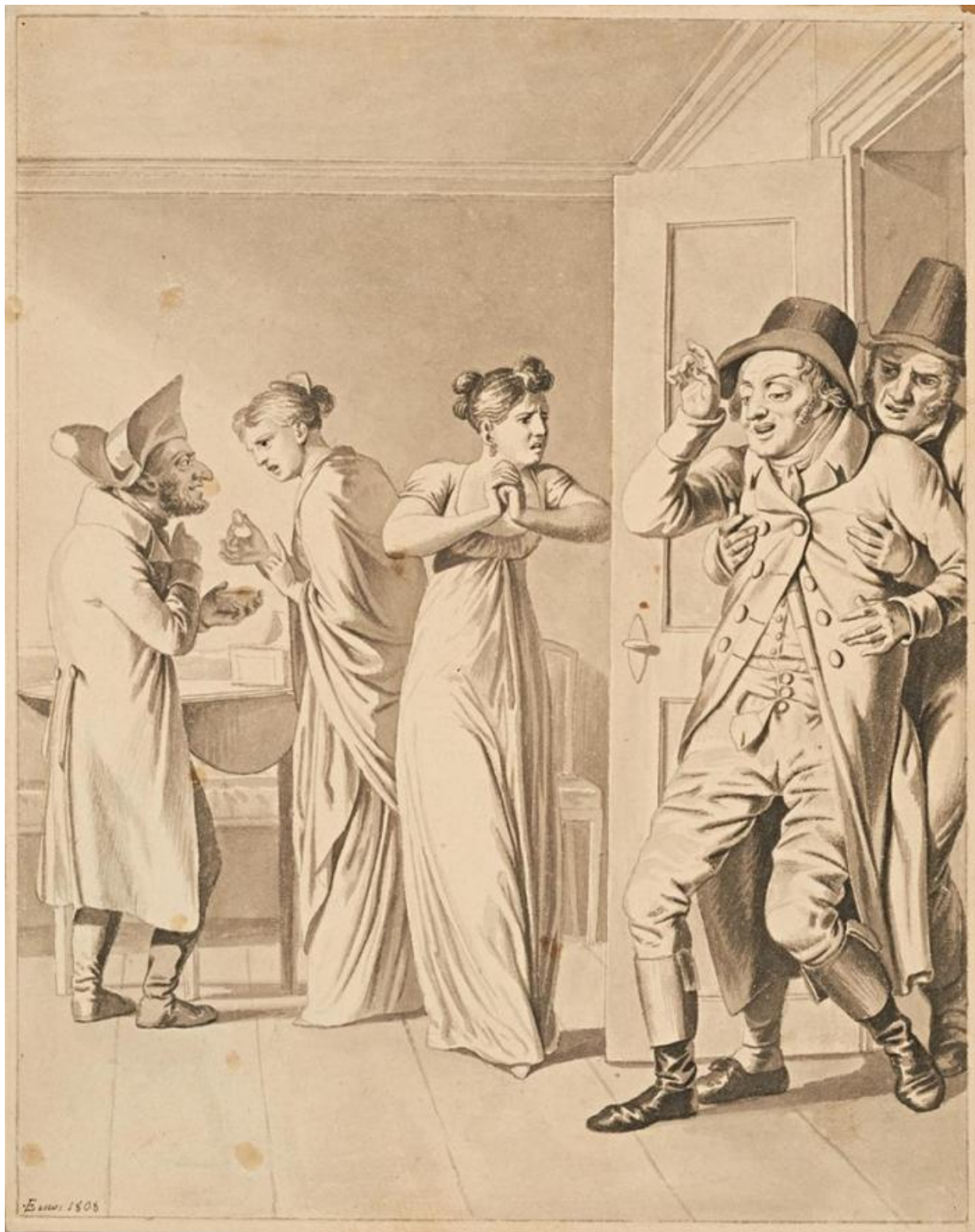
Fig. 8. C.W. Eckersberg: Lotterisedlen V. Aftagelse i velstand . 1808. Tusch med pensel. 280 x 222 mm. Den Hirschsprungske Samling, inv.nr. DHS691.

Napoleon stadfæstede den emancipation af de franske jøder, som revolutionen havde bragt med sig i 1791, og overalt hvor han kom frem, fik jøderne bedre forhold blandt andet med afskaffelsen af de ghettolove, der bød jøderne at bo bestemte steder og holde sig inde om natten. 23 Da den østrigske kejser Franz I (1768-1835) i 1806 bad sin ambassadør i Frankrig, fyrst Klemens von Metternich (1773-1859) om at rapportere om situationen, fortalte Metternich, at jøderne betragtede Napoleon som en messias, der endelig ville befri dem. 24 Det er muligt, at pantelåneren sender en hilsen til denne jødernes messias med hatten vendt på samme måde. Det skal dog siges, at denne hattetype ikke var ualmindelig, så den udgør også ganske enkelt en del af hans helt ordinære påklædning.